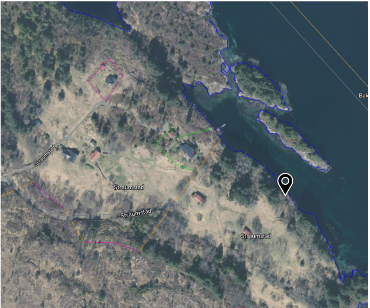
Markør viser ca omsøkt tiltaks plassering