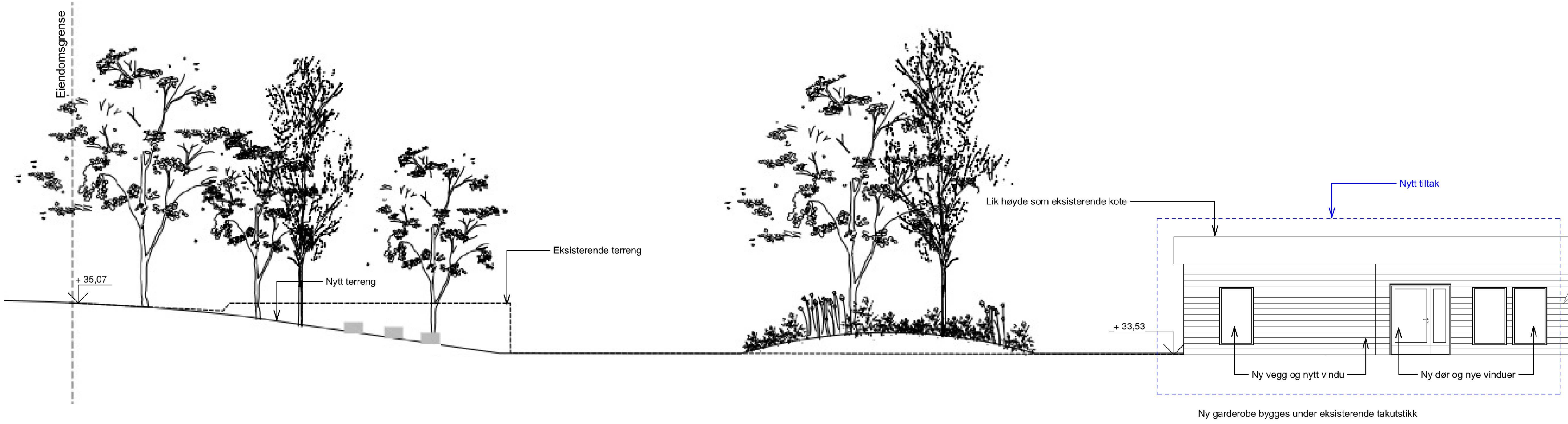
Oppriss fasade Sørvest 1 : 100