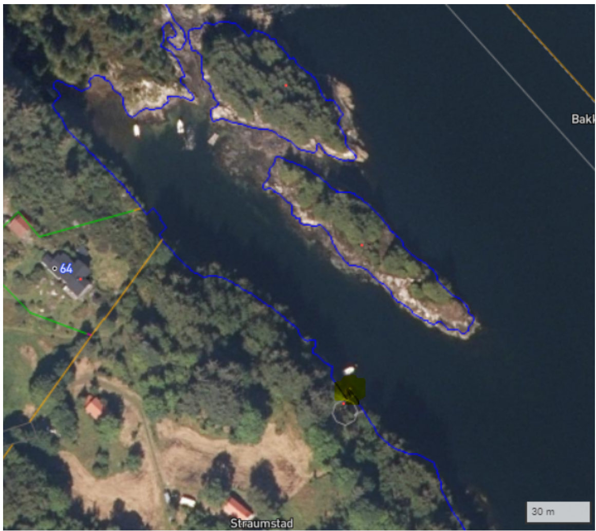
Omsøkt område ca. markert med gult