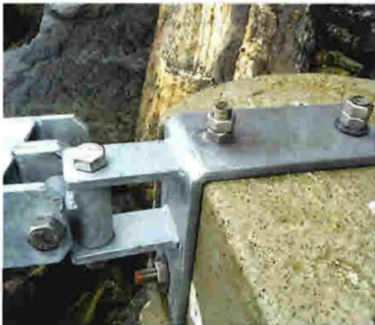
Gangbro vil bli festet på dagens kai. Det vil bli trolig bli nødvendig å sikre festepunktene med noe betong. Dette vil bli avklart med valgt montør.