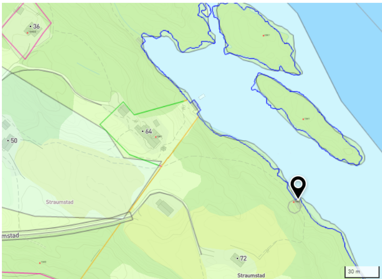
Utsnitt av KPA for omsøkt område

Det er kome inn dispensasjonssøknad om flytebryggje på Straumstad. Søknaden krev dispensasjon frå kommuneplanens arealdel (LNFR på land og bruk og vern av sjø), byggjegrænse mot sjø og pbl. § 1-8.