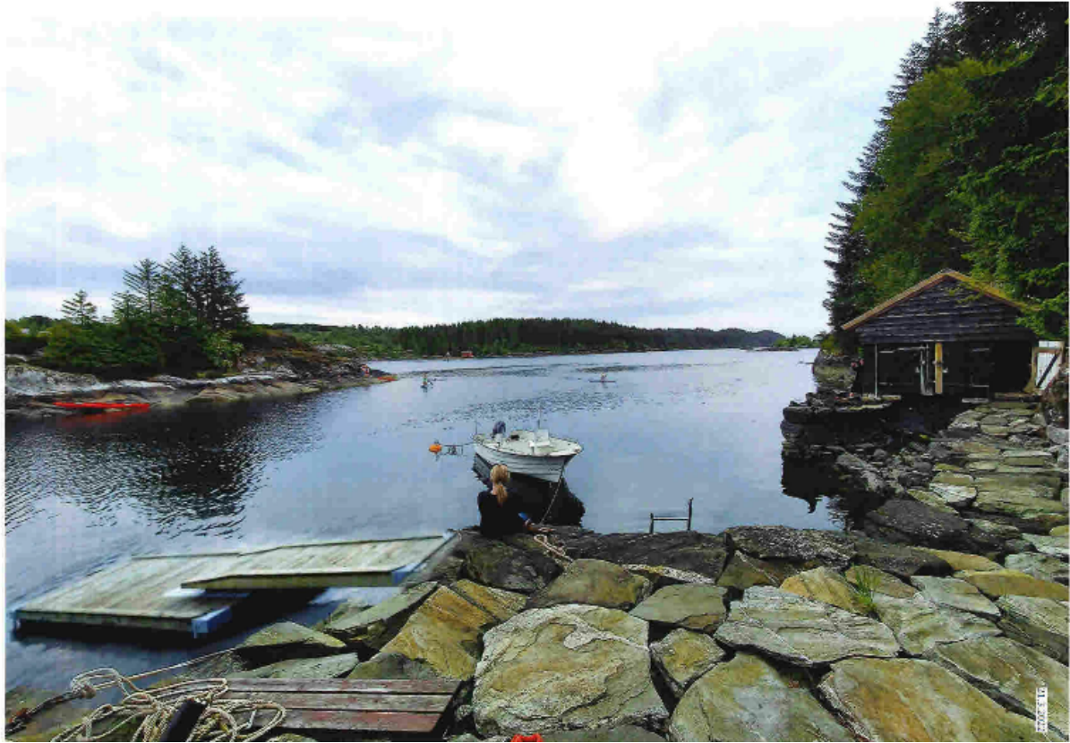
Dagens situasjon med omsøkt flytebrygge lagt inn i bilete til venstre.