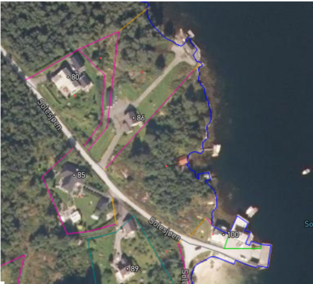
Flyfoto over området, dett er ikkje urørt natur, skog i attgroing her