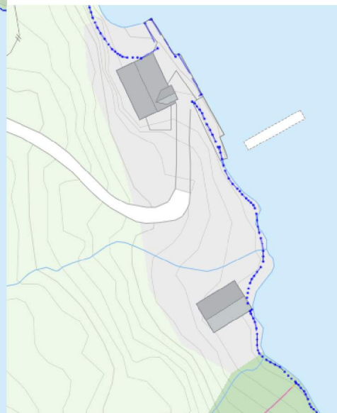
Omsøkte tomtar ligg ved dei eldre nausta her