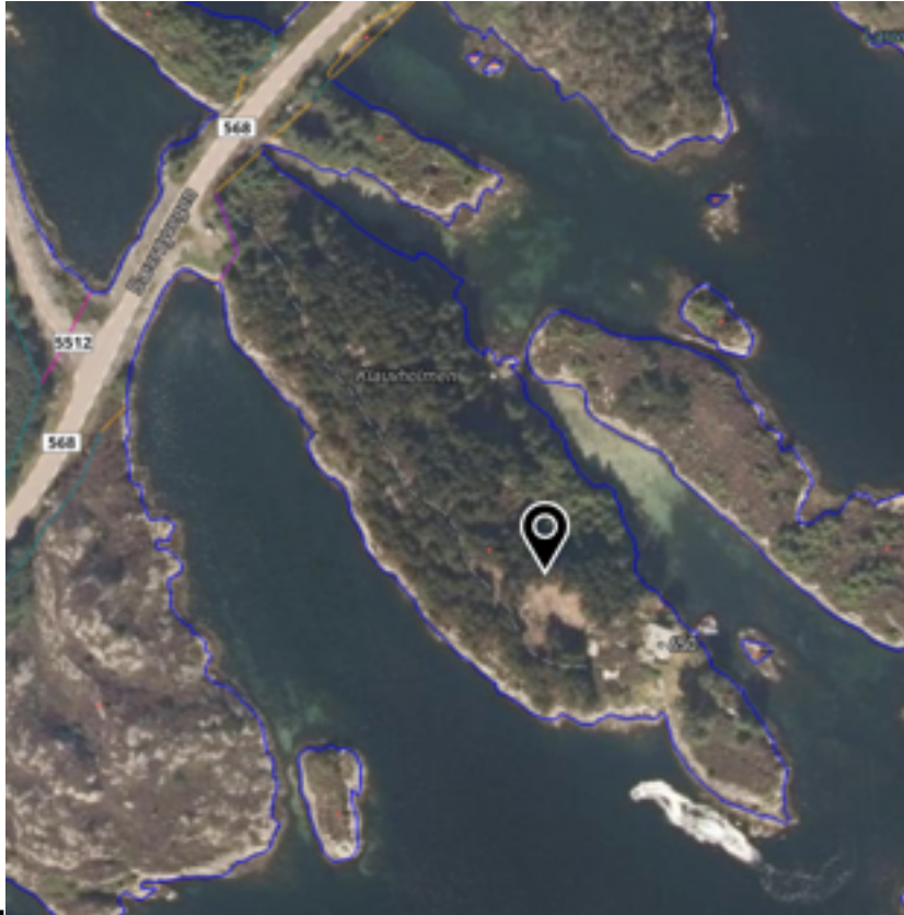
Flyfoto 2020 viser barskogen med sitka og furutre på Klauvholmen