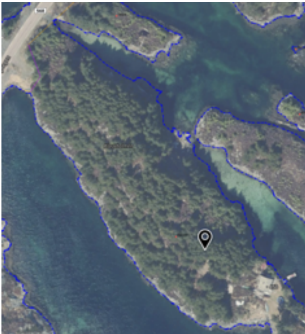
Nærfoto av den attgrodde holmen som eigar ynskjer å opne opp att slik den var i 1967 då hytteeigedomen vart etablert her. Sjå flyfoto frå 1967 under: