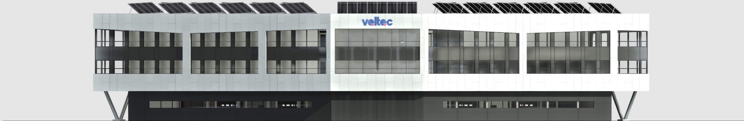
V E S T