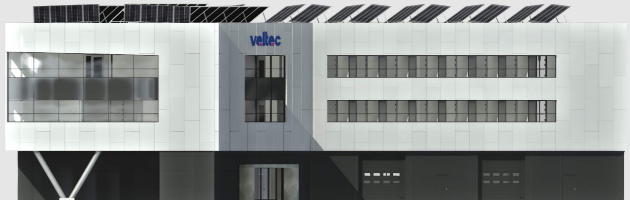
S Ø R Ø S T