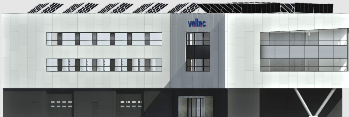
N O R D Ø S T