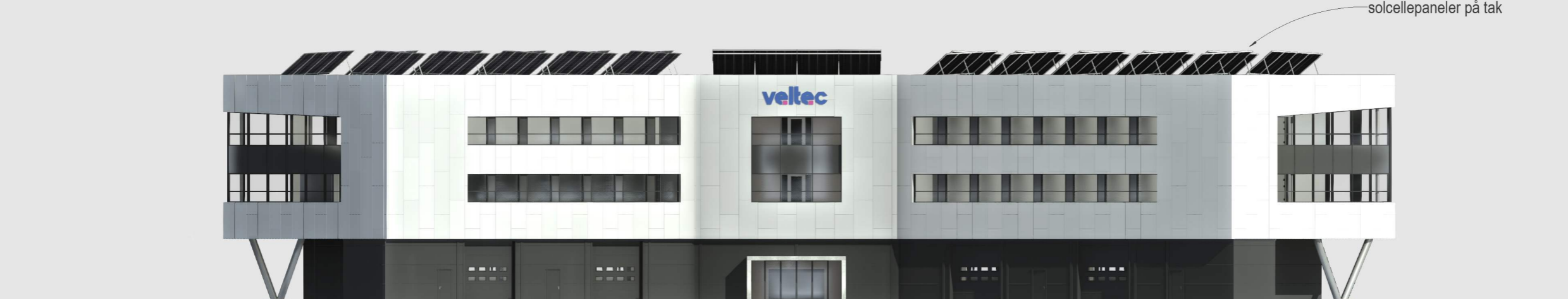
Ø S T