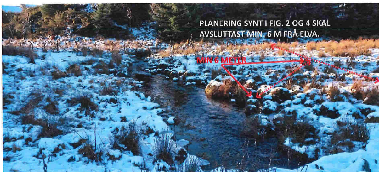
Fig. 3. Nedstraums elvekryssinga skal bekken framleis liggje open som i dag, men den må kunne reinskast når det er naudsynt. Det gjeld òg for den kommunale eigeodomen på andre sida av gjerdet. I Høgre biletkant vil planeringa/fyllinga synt i fig. 4 kome ned mot elva og skal avsluttast ikkje nærare enn 6 m frå elva.