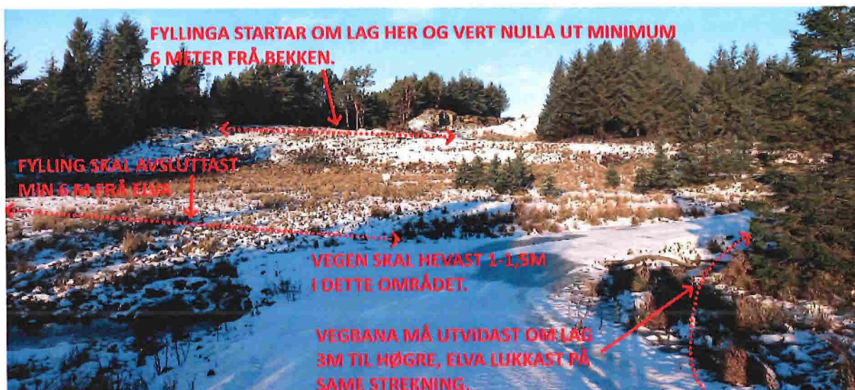
Fig. 2. Bakken lengst borte skal jamnast (planerast) ut om lag ned mot der den stripla lina markerer at bakkenivået vert nådd. Sjå òg fig. 4. I tillegg må vegen i framkant utvidast i innersvingen. Dette då den i dag er for krapp slik at det ber utfordrande å kome forbi med større bilar. Elva som vegen kryssar her, må leggjast i røyr om lag 3 meter utover dagens situasjon dvs frå vegen og om lag til den stripla lina. Vegen må òg hevast om lag 1-1,5 m i denne svingen. Utover dette skal elva framleis liggje open som i dag, men den må reinskast når det er naudsynt. I dette området ligg det ein kommunal vassleidning som det lyt takast omsyn til.