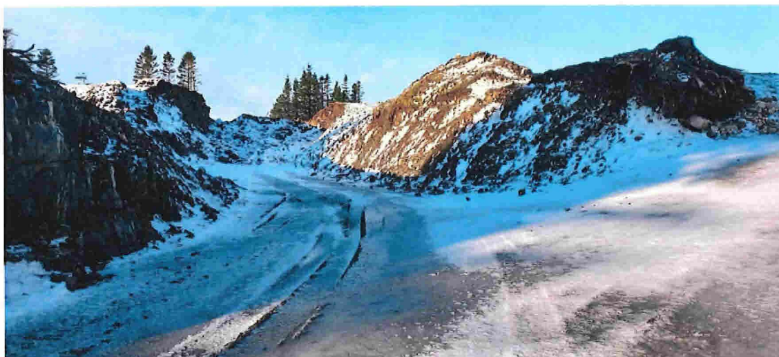
Fig. 6. Skjeringane skal flatast ut noko og fyllast på med jord. Dette for å dempe skjeringane. Vegen skal halde fram inn på naboeigedom (gnr. 156, bnr. 17) og samtykkje frå eigar må vere på plass før vegbygginga startar opp.