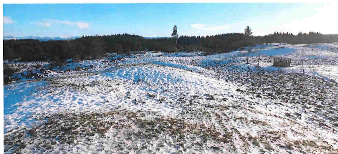
Fig. 8. Nordaust for området ser beitet slik ut i dag.