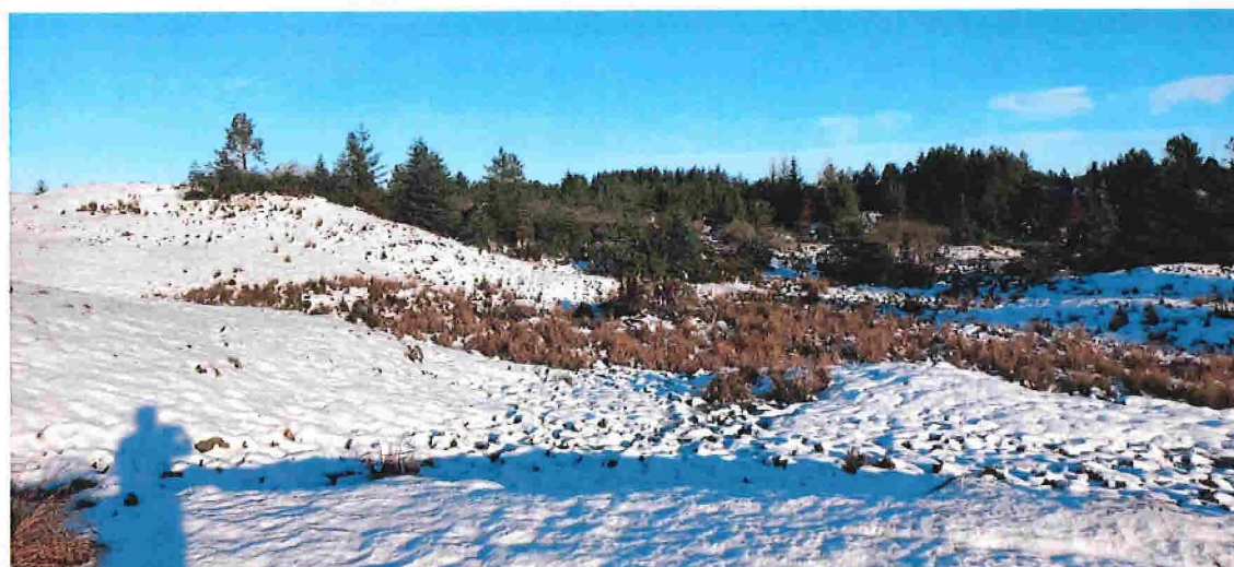
Fig. 7. I dette området vil det verte lagt eit tynnare lag med masse i dei våte søkka.