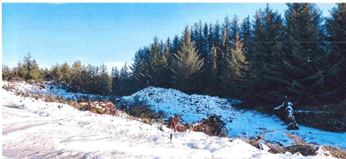
Fig. 5. Her er matjordlaget teke vare på. Det skal planerast ut med tilkøyrtte massar og der matjordlaget vert lagt oppå. Dette vil gje eit godt beite.