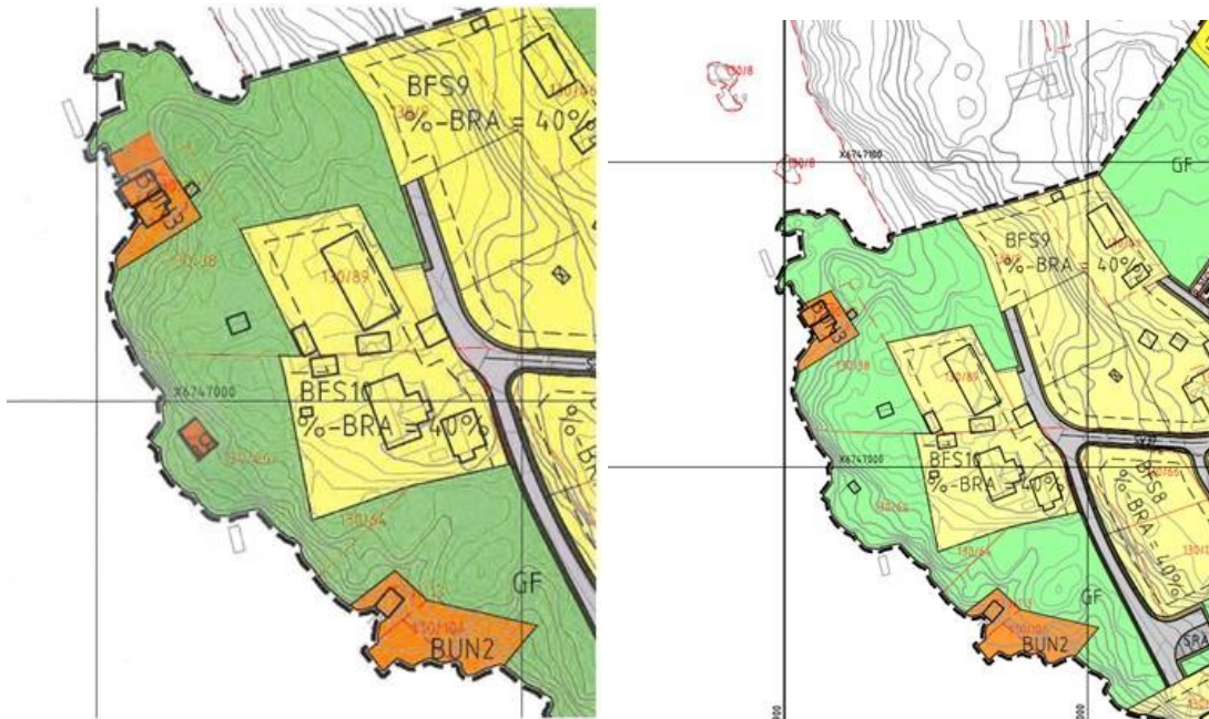
Forslag til planendring (plankart over)