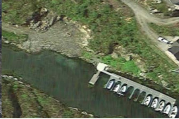
Planlagt naustområde vert på planert område over