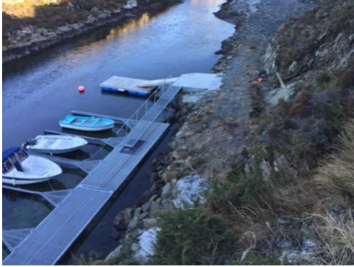
Foto av småbåtanlegg

Den nye hyttetomten er aust for køyrevegen til naustområdet og ved eksisterande hytte. Fellesnauset skal plasserast på innsida av vegen som er langs strandområdet her, all eksisterande og skjemmaende skjering i terrenget vert då skjult. Sjå foto under av eksisterande situasjon i strandområdet.