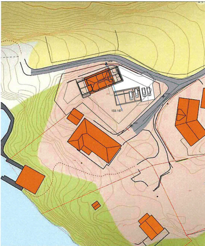
Situasjonskart - 133 bnr 67