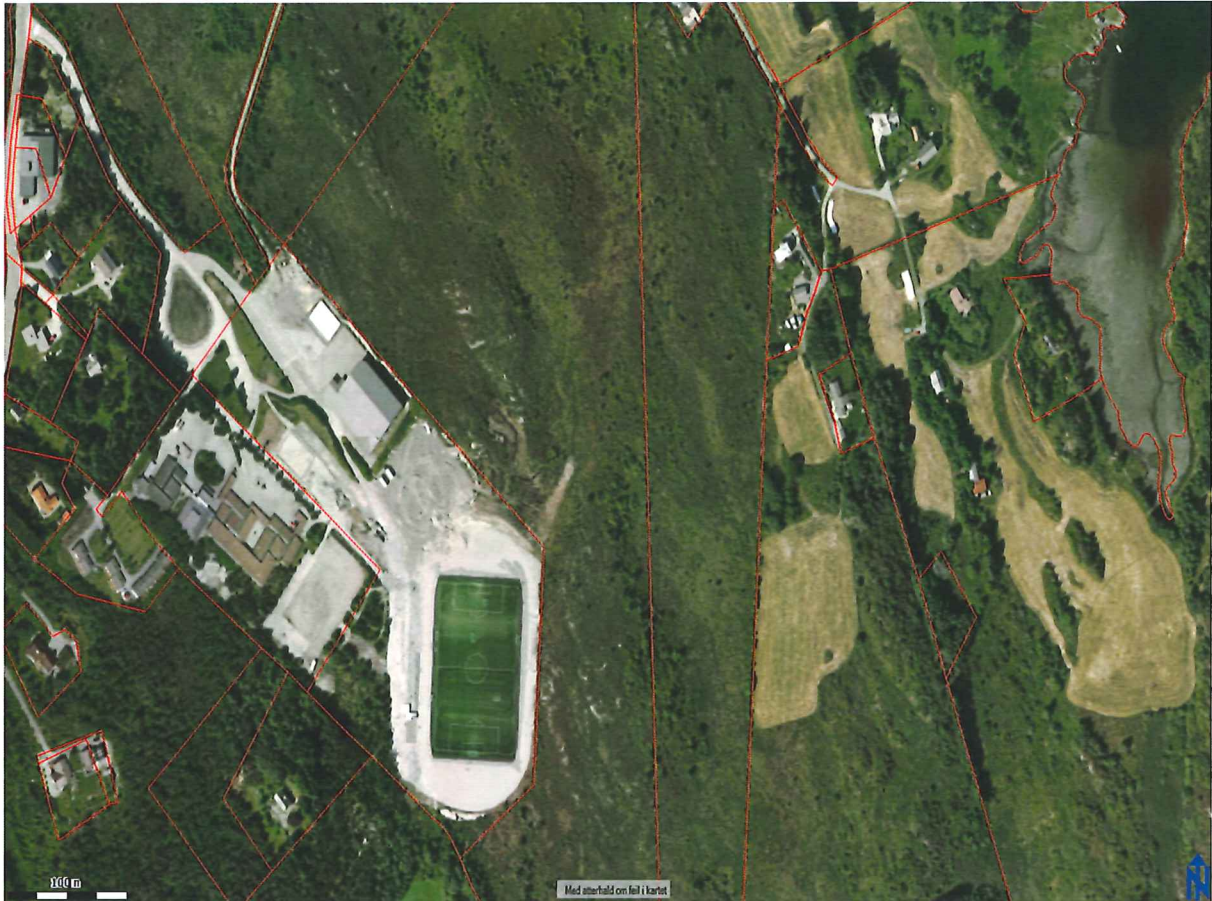
Flyfoto over viser planområdet med parkering, veg og skule- og idrettsområde på Årås.

Austrheim kommune ser at det er naudsynt å gjennomføra ein reguleringsendring på eigedommane som kommunen eig her og på den kommunale vegen her slik at bruken av desse areala framover vert i tråd med anleggsplanen som nyleg er ferdig. I dag er deler av dette arealet regulert til grønststruktur der det no er planlagt ein parkeringsplass. Reguleringsføresegnene i utbyggingsplanen og plankartet godkjent i 2008 styrer såleis bruken av desse areala i dag. Arealet som skal regulerast om er på om lag 80 dekar. Det er særleg viktig å få på plass ein planendring for å trygga dei mjuke trafikantane i området og for å få ein god trafikkløysing for skulebussane, tilsette og foreldre.