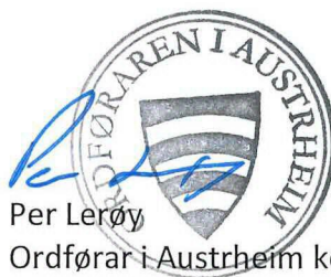
Per Lerøy Ordførar i Austrheim kommune