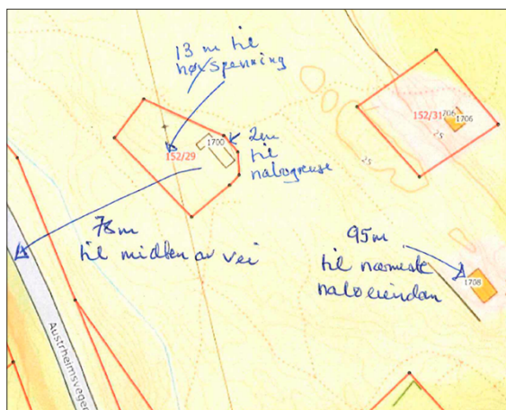
Utsnitt frå situasjonskart frå søknaden, med byggegrense til veg.

Eigedomen for tiltaket ligg i LNFR område i Austrheim sin kommuneplan (2019-2029), med planID: 2013001.