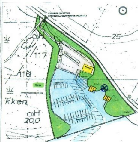
Plankart av reguleringsplan frå 1996