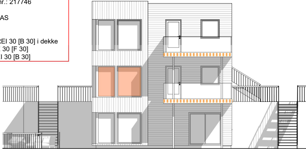
1:100 Fasade Nordøst

REI 30 [B 30] i dekke E 30 [F 30] EI 30 [B 30]