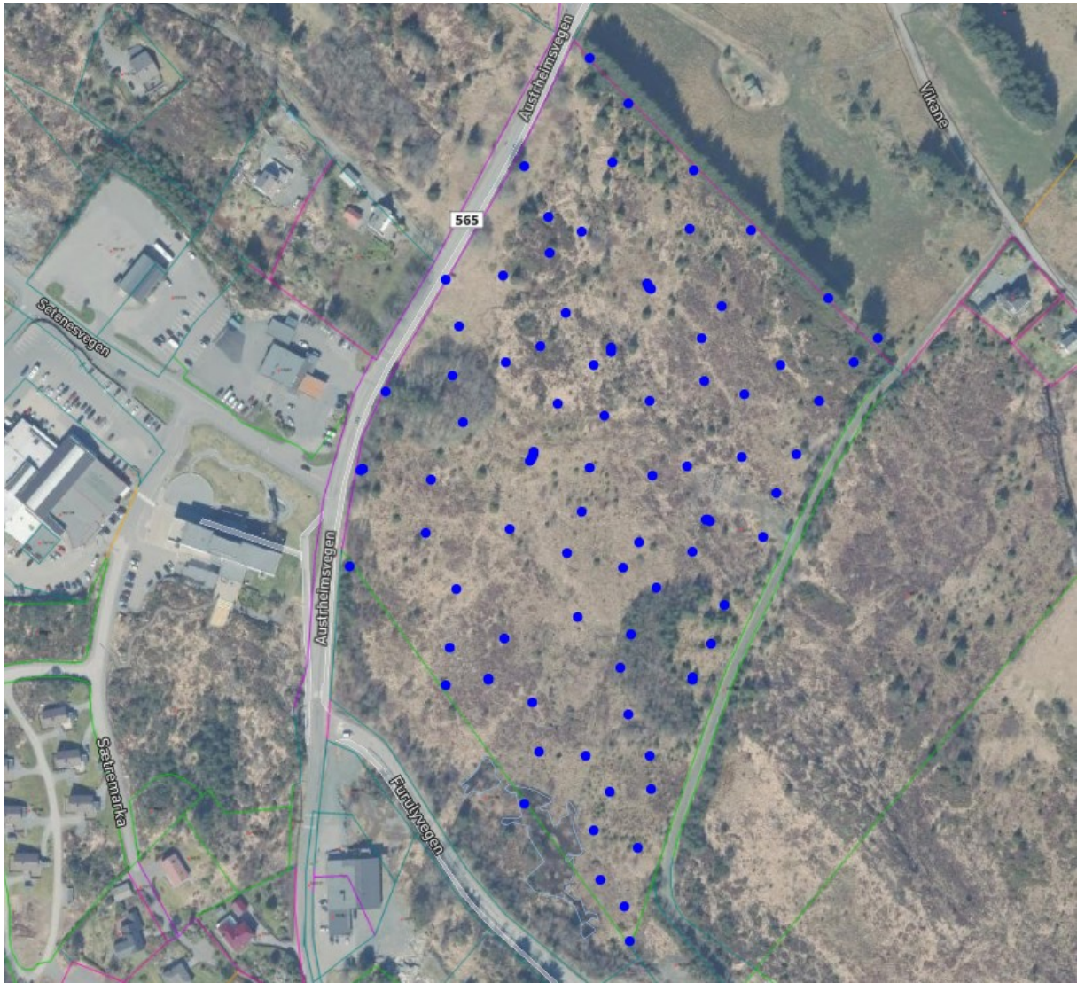
Område 2 (sør for bensinstasjonen i kommunesenteret)