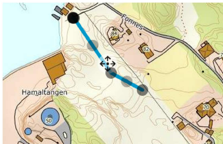
Ny landbruksvei i LNFR – 118m lengde ca 4 m bredde = min 472m 2