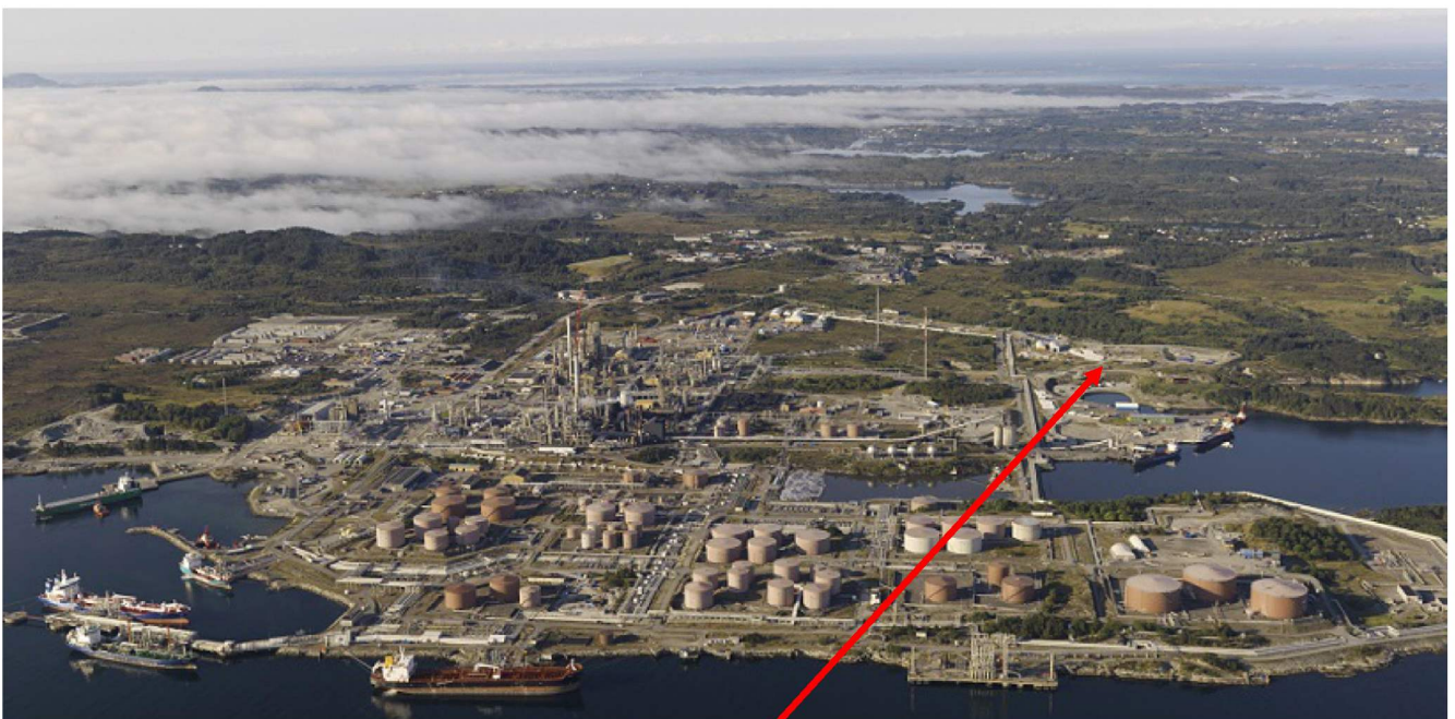
Oversikt over Mongstad og plassering av hallen