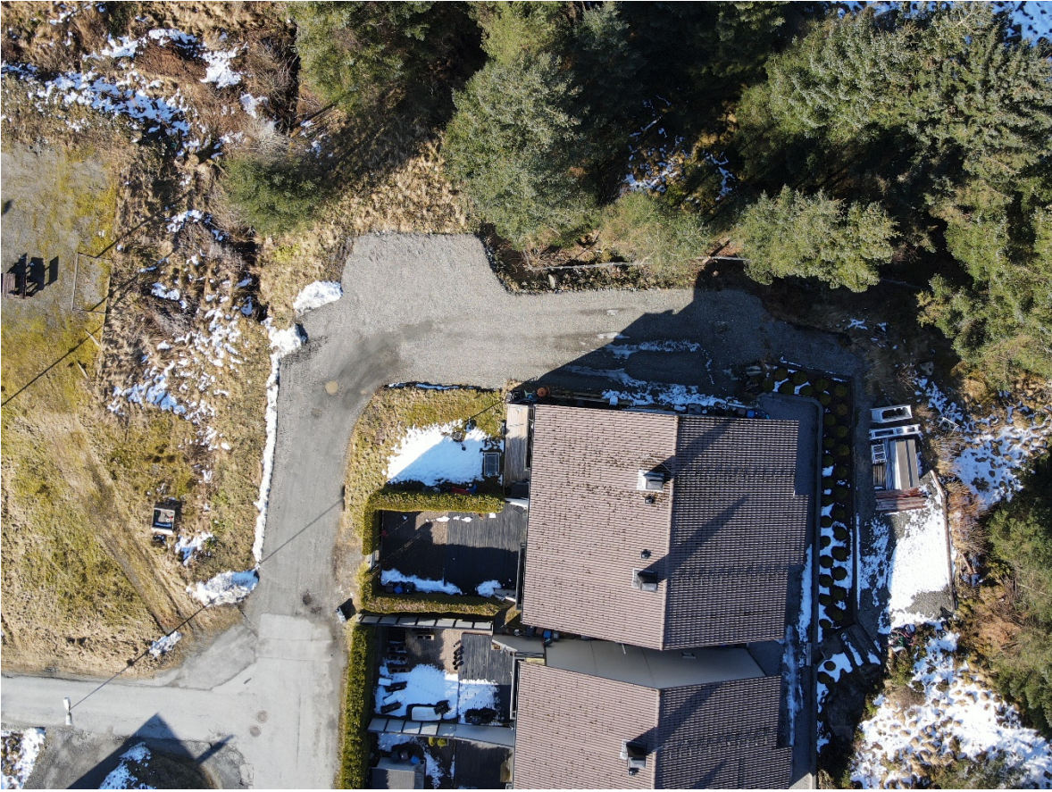
Bilete av tilkomstvegen.