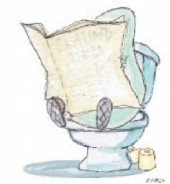
Illustrasjon: Gunvor Rasmussen