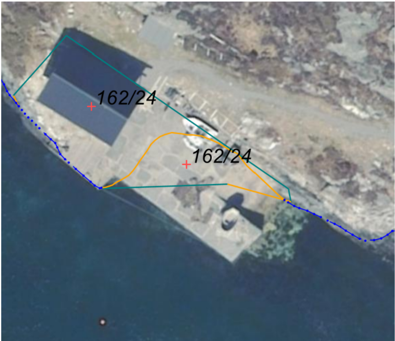
Flyfoto frå omsøkt område

Tiltaket er ikkje til ulempe for friluftsliv, ålmenta, fiskeri eller for biologisk mangfald i området. Austrheim kommune meiner at det totale arelingrepet i området vert minimalt med dette tiltaket, sjå mellom anna søknad og feste av flyebrygge skal monterast i allereie etablert kaistruktur. Det er ikkje eit urørt område. . Totalingrepet i sjøen og på land vert beskjeden. Tiltaket er også reversibelt. Grunngevinga til søker er og overbeisande. Eit positivt vedtak frå kommunen forutsetter i alle høve løyve frå Bergen og Omland havnevesen.