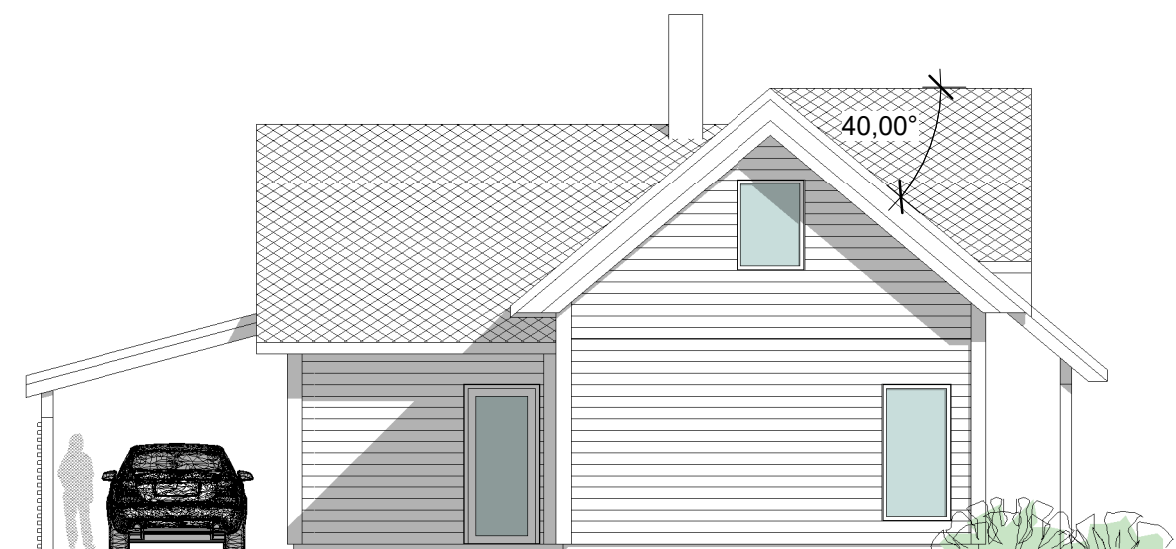
FASADE MOT NORD