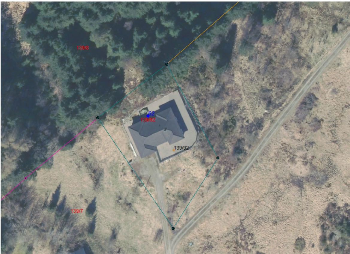
Figur 2 Kart etter retting