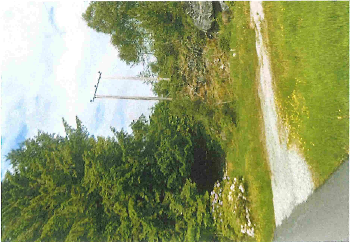
Strømledning går over profil 13, så høyt at det trolig ikke utgjør noen risiko for høye biler.