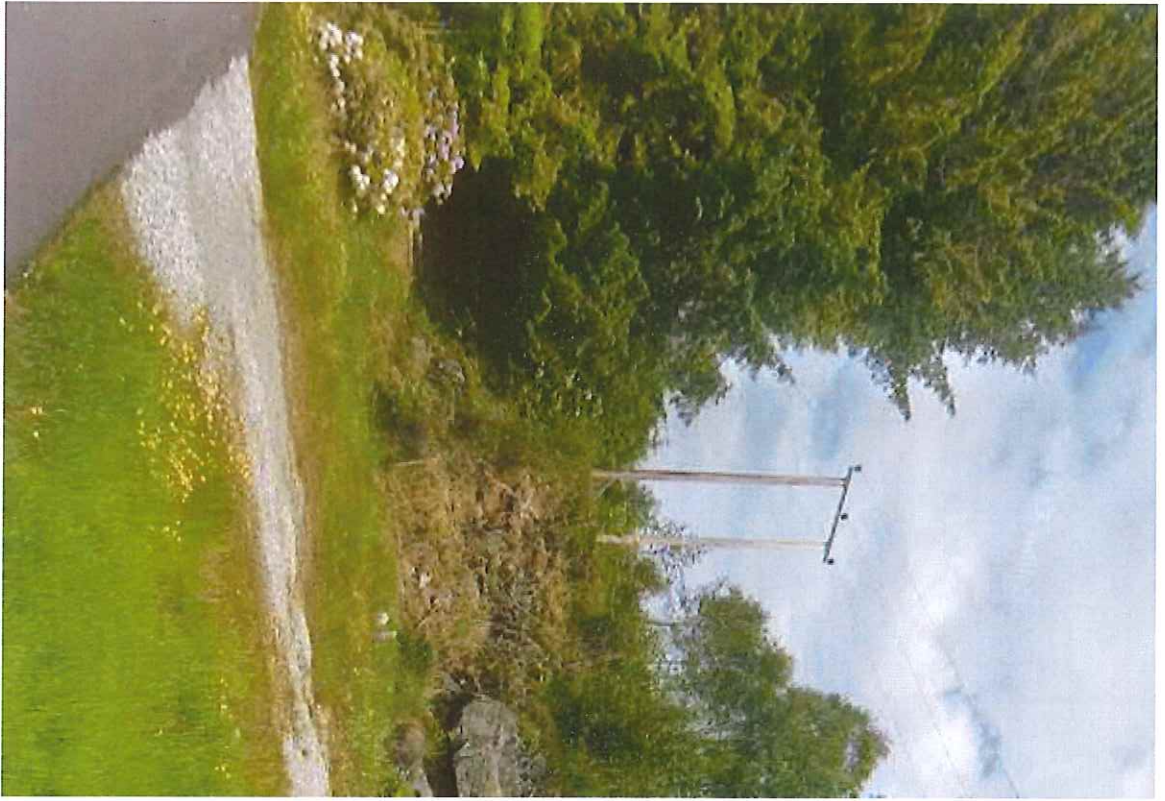
Strømledning går over profil 13, så høyt at det trolig ikke utgjør noen risiko for høye biler.