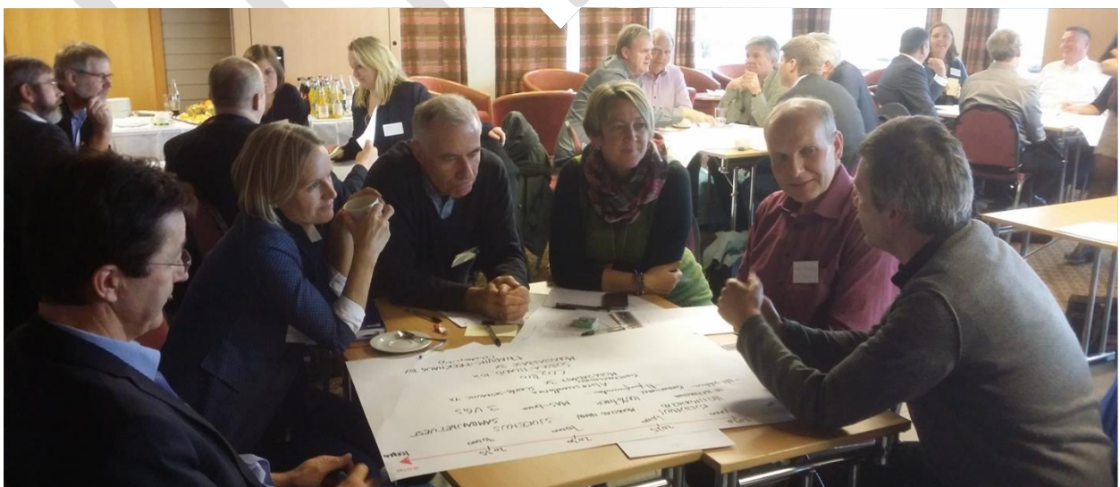
Figur 3. Politikarar, kommunetilsette og representantar frå næringslivet drøftar framtidig utvikling i Nordhordland. Frå gruppearbeidet på kick-off samlinga i november 2014.

Planen vert sendt på offentleg høyring. Etter dette vil innkomne merknader til planen vurderast og planen gjerast klar for endeleg vedtak i Regionrådet og kommunestyra.