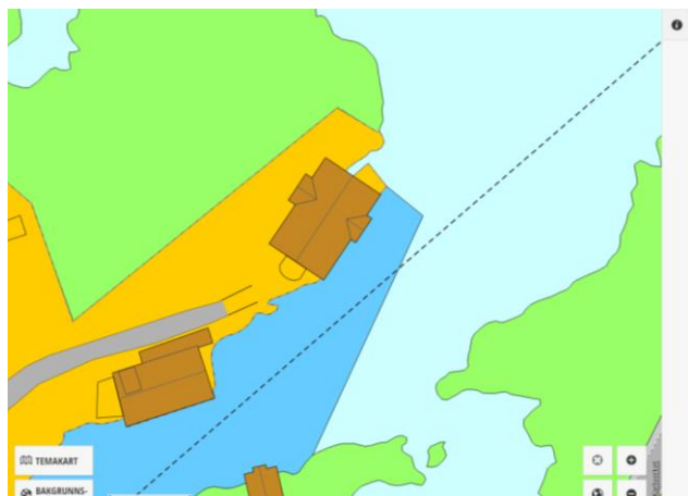
Fig 3: Kommuneplanens arealdel (KPA) – kart (utsnitt)

Planstatus for området viser at det ikke er åpnet for bygging av brygger eller kaier her. Området er på sjøsiden vist som sjø. På landsiden er det regulert til LNF ( Landbruk, natur og friluftsliv ). Videre er det etter kommuneplanens arealdel (KPA) krav om utarbeidelse av reguleringsplan ( plankrav ). Det er ikke laget reguleringsplan. Tiltaket er derfor også i strid med to deler av kommunens planverk.