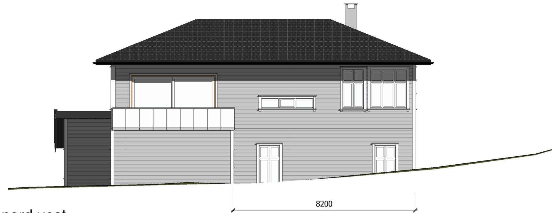
Fasade nord vest 1 : 100