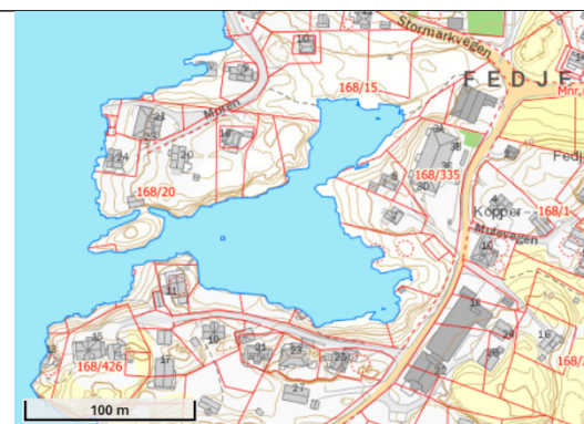
Stormflo no – intervall 20 år (fylkesatlas.no)