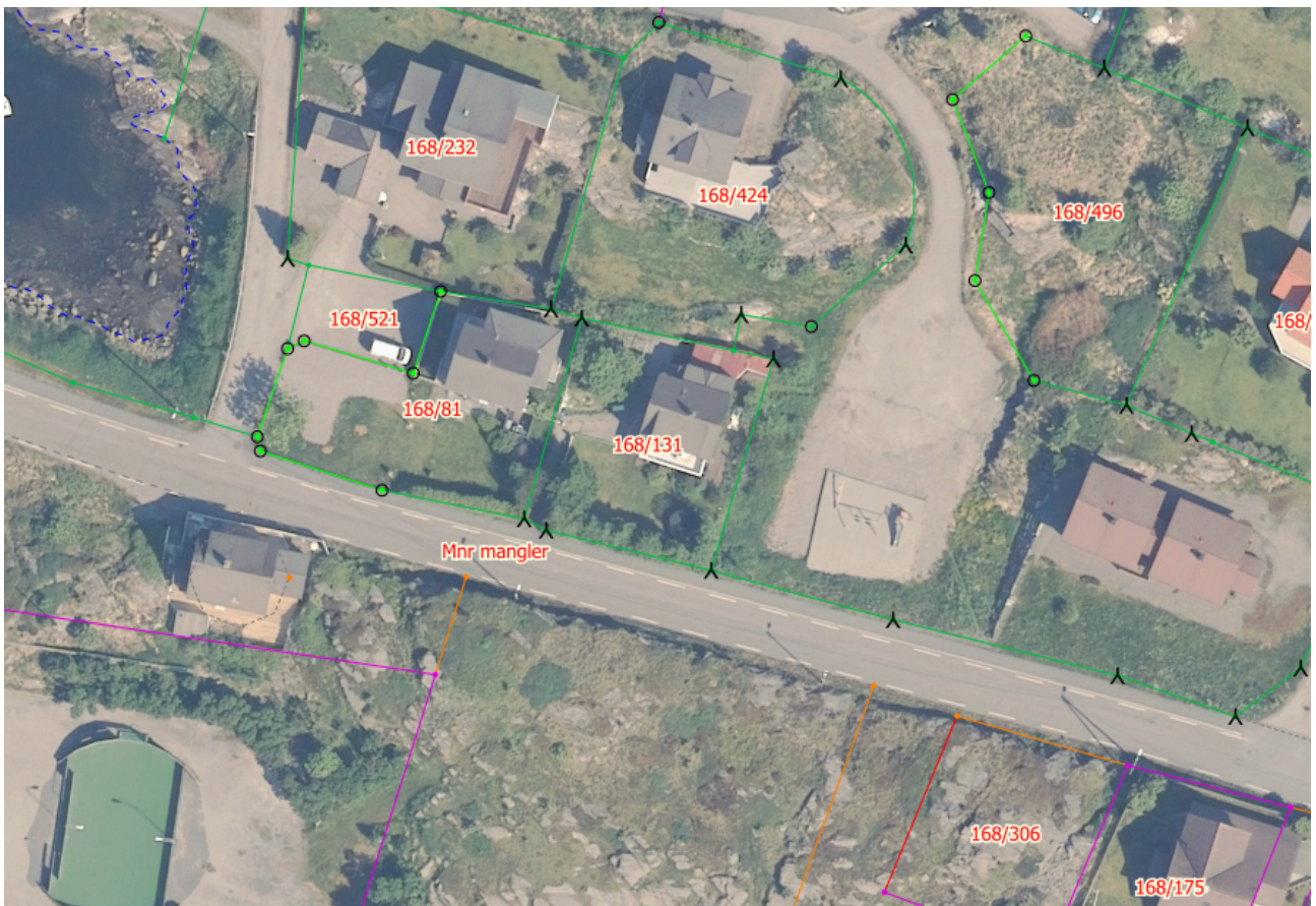
Figur 1 Kart over området

Austrheim kommune ser at arealoverføringa er arealmessig fornuftig, søknad er i tråd med plan- og bygningslova, reguleringsplanen og anna lovverk. Søknad kan difor godkjennast som omsøkt. Saka vert med dette sendt over til vidare oppmålingsforretning.