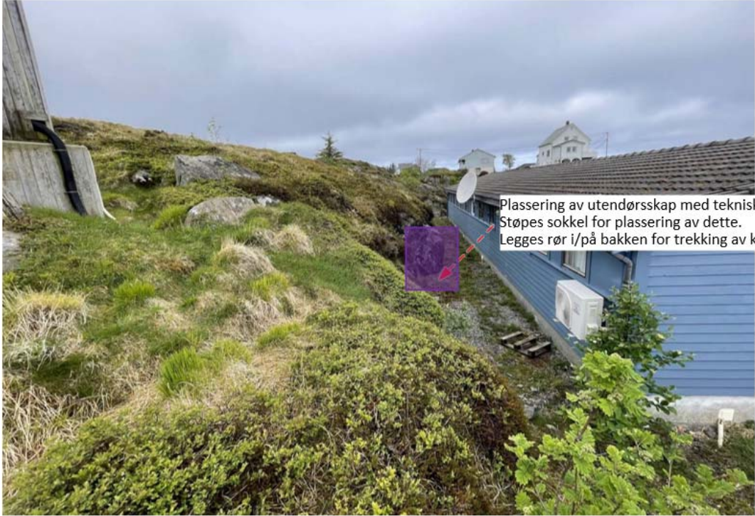
Plassering av utendørsskap med teknisk utstyr. Støpes sokkel for plassering av dette. Legges rør i/på bakken for trekking av kabler til antenner i mast.