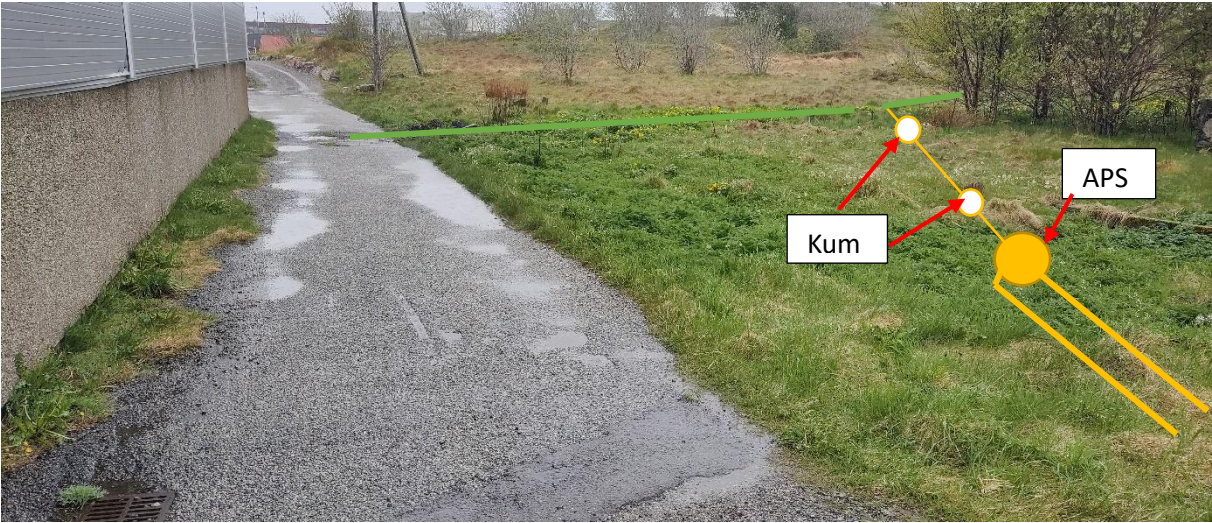
Prinsippskisse frå APS mot veg