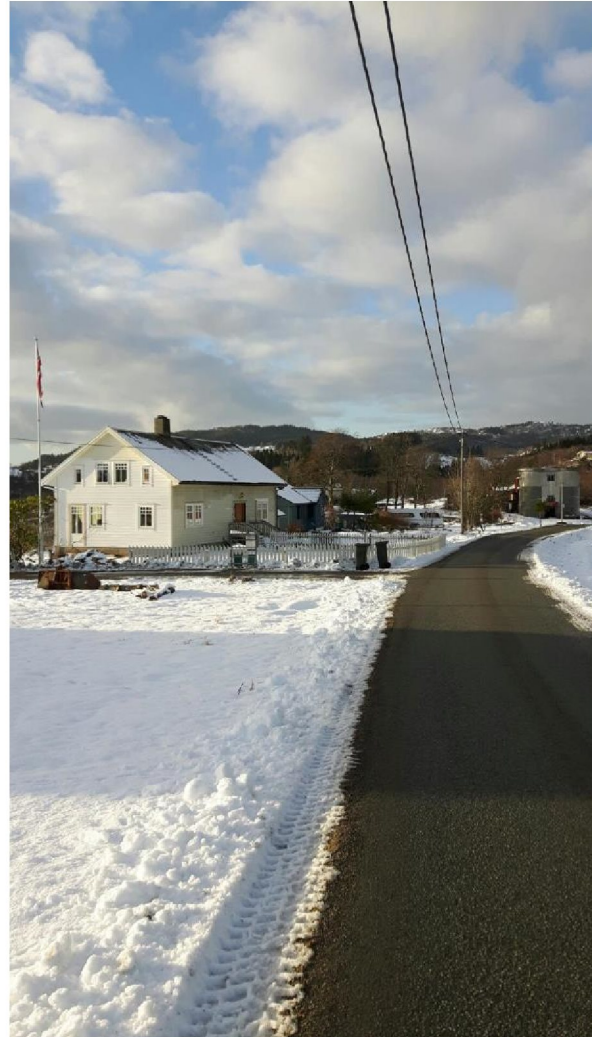
Bilde tatt frå sør-aust

Me har vurdert det til at ark på eine side, sjølv om det er takoppløft på den andre, ikkje vil foringa den visuelle kvaliteten på eigedomen, og ein vil uansett ikkje «oppleva» begge sider samstundes. Vidare vil det etter vårt syn heva det visuelle uttrykket forbipasserande får, og vera meir i stil med tradisjonen i området, å byggja ark som omsøkt.