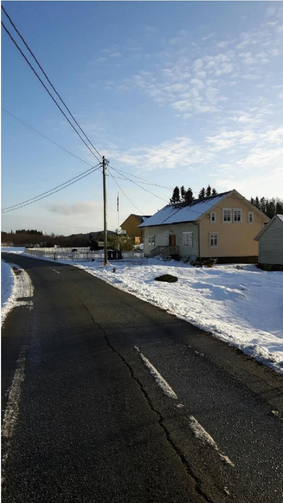
Bilde tatt frå Nord

Bilda under er tatt frå ulike retningar og mot bygget og viser kva ein vil sjå når ein passerer. Begge bilda viser og at ein må bevega seg ganske langt inn på eigedomen før ein i heile tatt ser fasaden mot sør-vest.