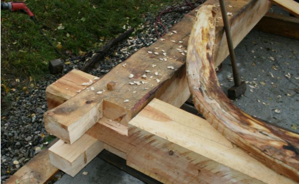
Samansetjing av grind med trenaglar (over). Tillaging av emne til snedband (under).