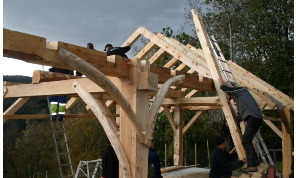
Grinder og takstolar på plass (over). Det vert nytta trenagle i staden for spikar (under).