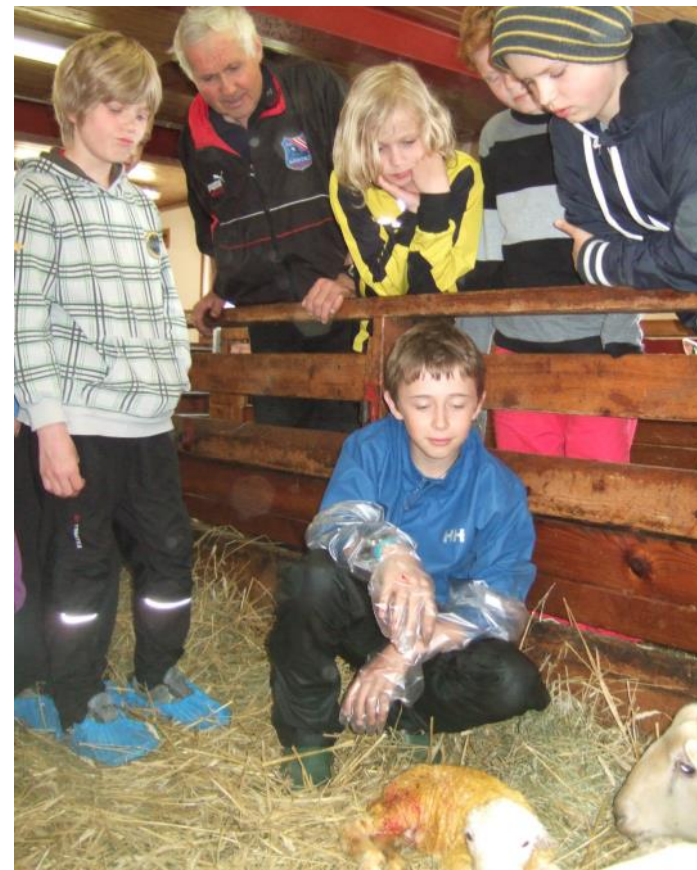
Det er mykje å oppleva i Kvemmadokkje og Børsheim, både for store og små.