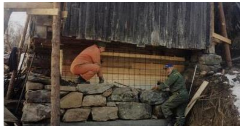
Ny gråsteinsmur på fjøs og løe.