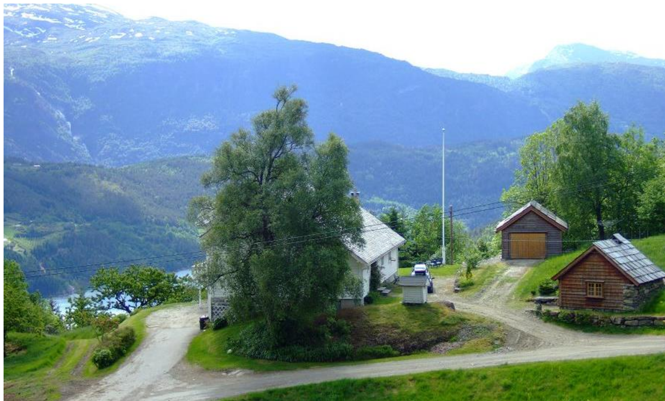
Hovudtunet med vedhus og mosstove.

I 1991 vart det bygd ei hytte nedanfor tunet i Kvemmadokkje, som no er nytta til utleige. I 1998 starta ei omfattande restaurering av bygningsmassen på husmannsplassen.