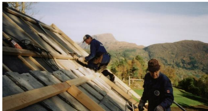
Arbeid med nytt rastatak på stovehuset.