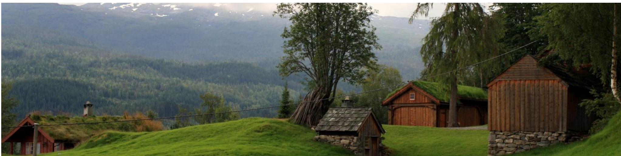
Kvemmadokkje med utleigehytte, mosstove, grindbygg og husmannsløe.