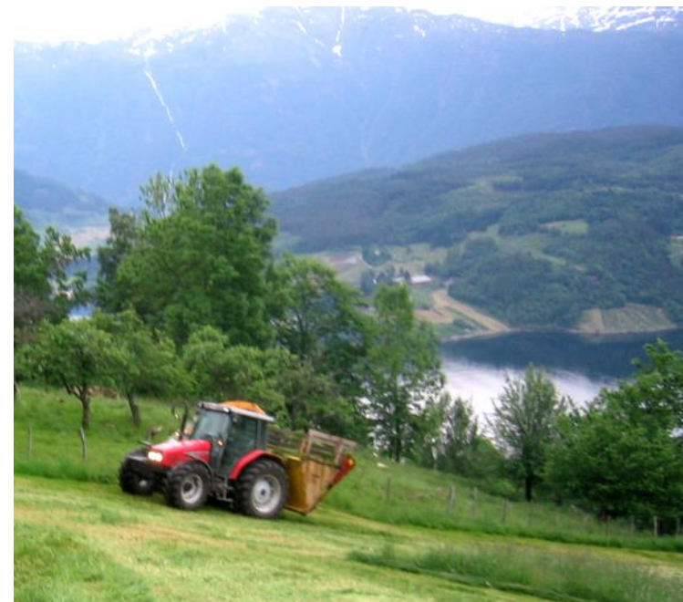
Tillaging av hes, fôrhausting i bratt terreng og hesjer i Kvemmadokkje.