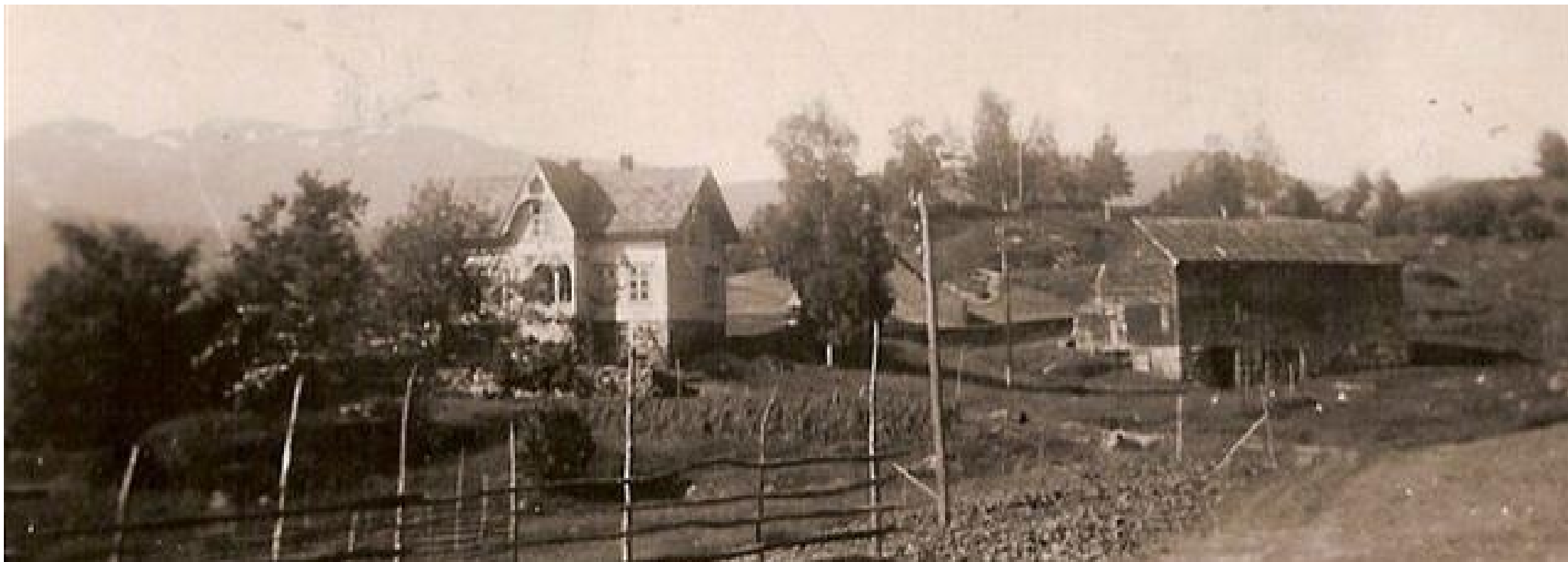
Garden Børsheim på 1930-talet. I dag har våningshuset fått påbygg og vorte restaurert, og ny driftsbygning har erstatta den gamle.