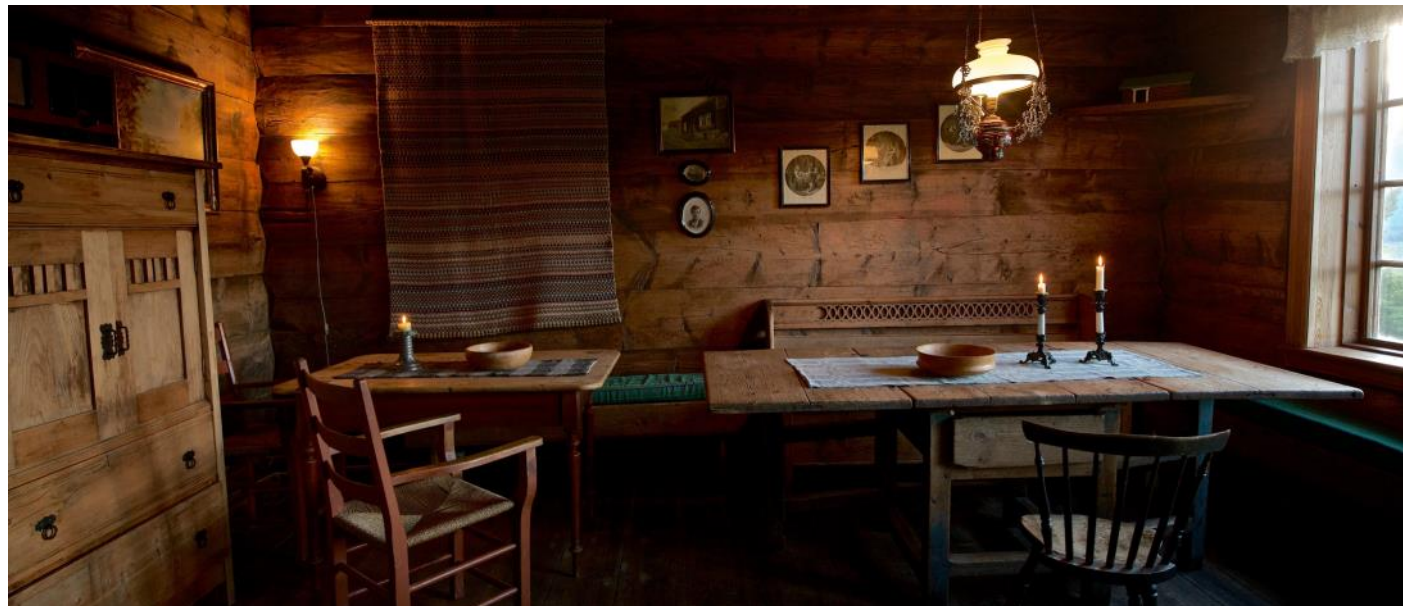
Over: Husmannstova med opphavleg inventar.

I perioden 2007–2009 vart deler av stovehuset utbetra for å kunna nytta det til utleige og arrangement. Det vart bora etter grunnvatn, laga nytt avløp, nytt kjøken, vassklosett og dusj, nytt elektrisk anlegg, og to nye soverom på loftet. Alt vart gjort skånsamt med omsyn til arkitekturen, og mesteparten av huset er slik som det var for 200 år sidan. Arbeidet vart støtta av Innovasjon Norge, og var eit viktig og naudsynt tiltak for å kunna utvikla den kulturbaserte næringa på garden.