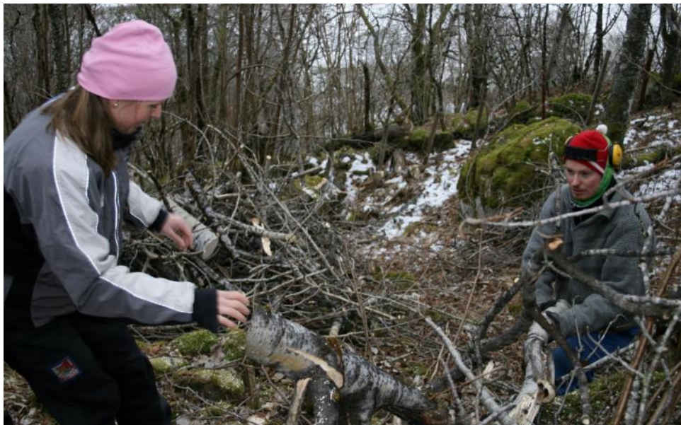
Pleie av kulturlandskapet i innmarka på Gjerdshaugen.