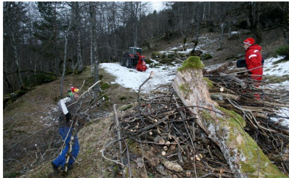
Rydding av kvist. Alle generasjoner er med på arbeidet.