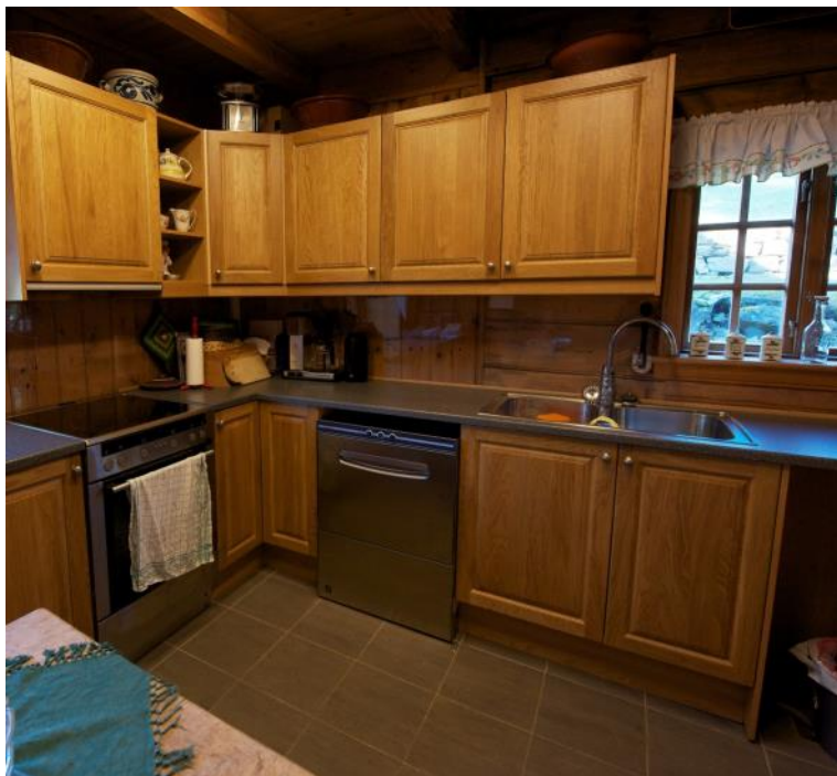
Under: Moderne kjøken, nytt soverom på hemsens, dusj og WC i det gamle vedskjulet.