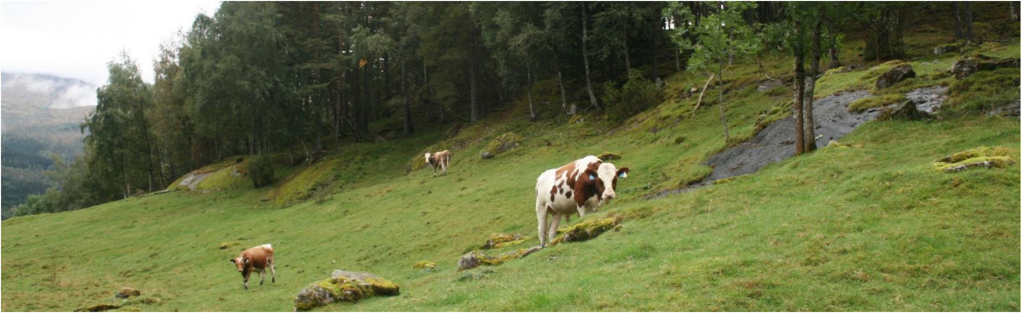
Dyr som beitar på Gjerdshaugen (over), Aosen (under t.v.) og i Bjørkehaugen (under t.h.).