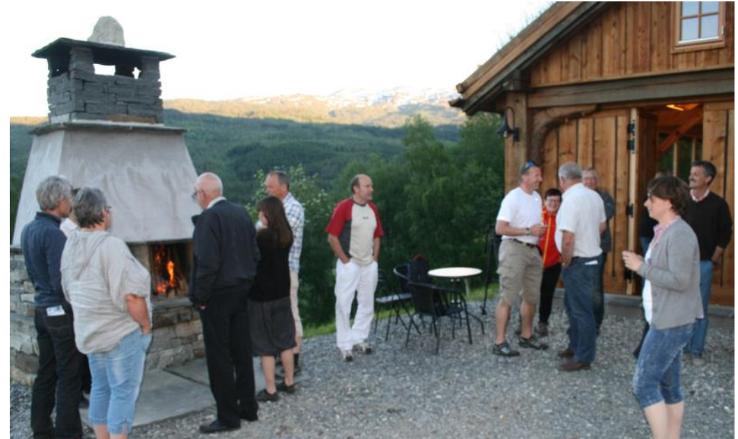
Gjester i tunet (over). 17.maifrukost 2013—"Alt For Norge" (under).