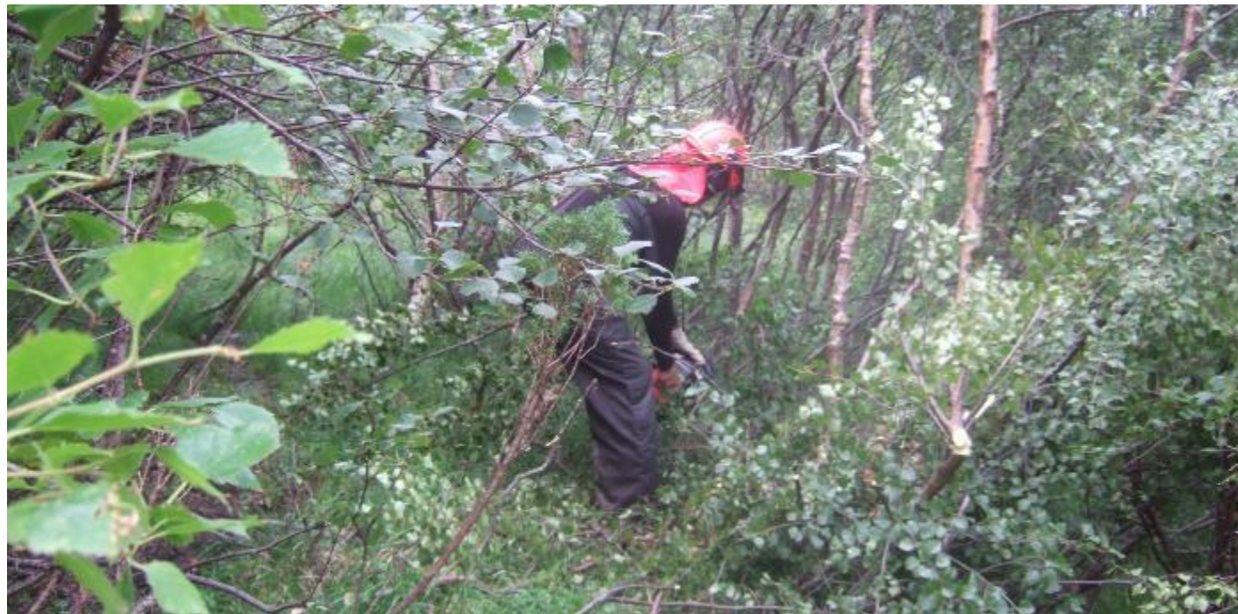
Rydding av sti i lia over Skitnasete.

Ryddinga og vedlikehaldet inneber kontinuerleg innsats. Arbeidet vert utført manuelt, ved hjelp av motorsag og anna handreiskap. Stiane vert rydda i god breidde med rikeleg plass til ferdsel i marka.