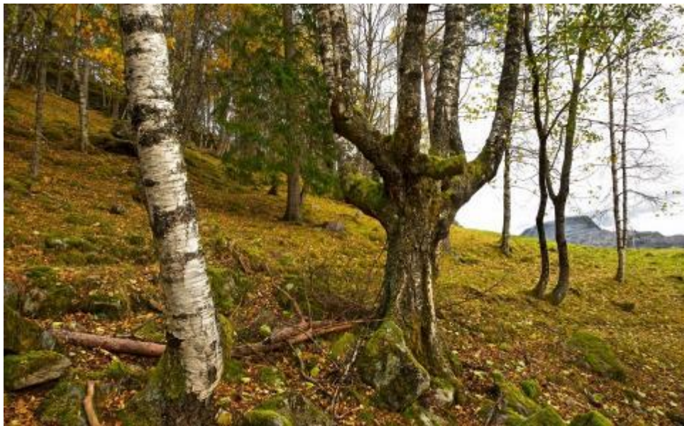
Ryddet kulturlandskap på Gjerdeshaugen.

I dag er det vorte grønt og frodig, og gjev gode beite.