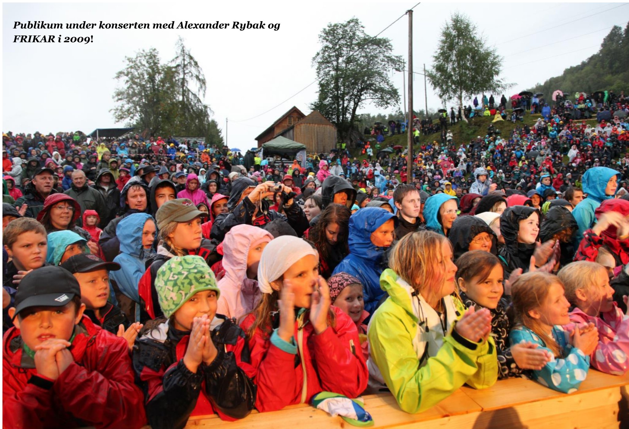
Publikum under konserten med Alexander Rybak og FRIKAR i 2009!