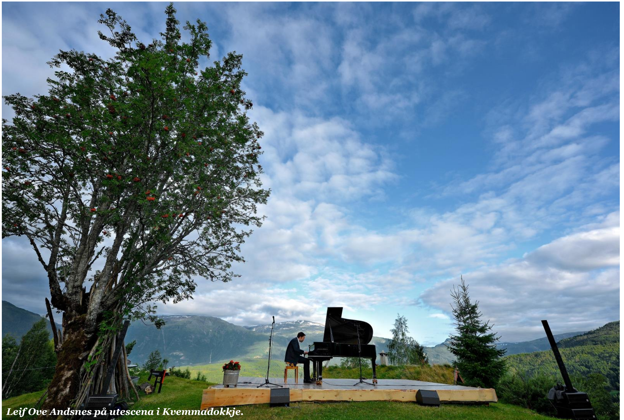
Leif Ove Andsnes på utescena i Kvemmadokkje.