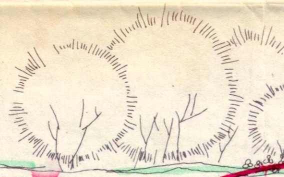
FASADE MOT NORD