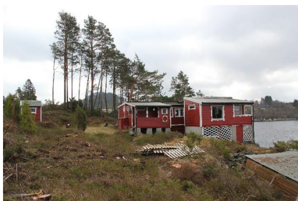
Eksisterende hytte sett fra vest, naust ses nederst t.v.