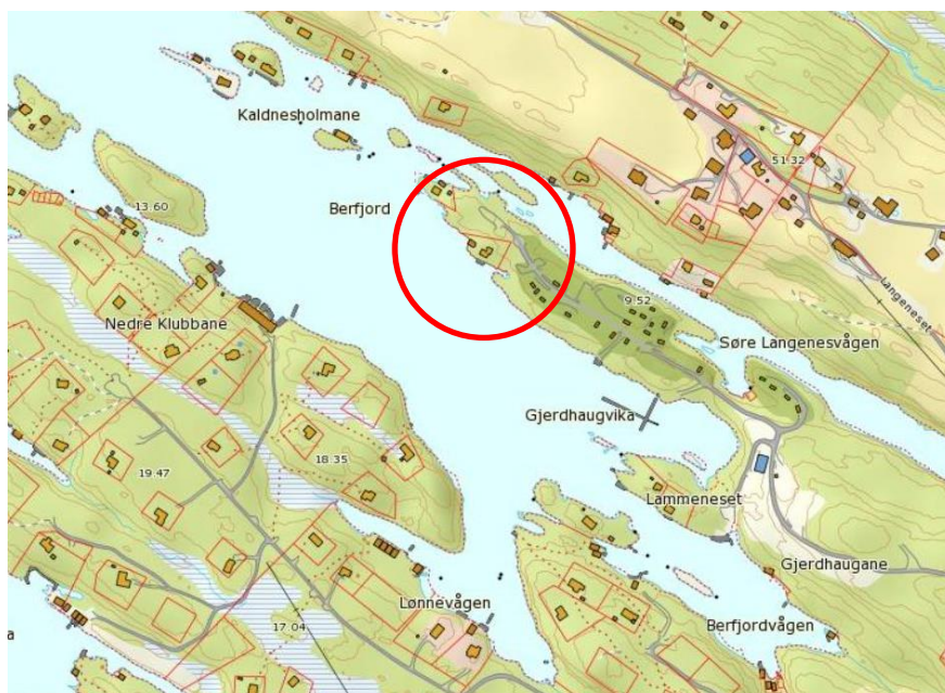
Utsnitt fra nordhordlandskart

Tomten er eksponert for vind og drev fra vest.