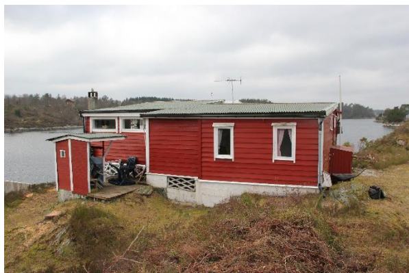
Eksisterende hytte sett fra øst

Det står en samling furutre i tomtens nordøstlige hjørne som ønskes bevart, ellers er tomten bevokst med lyng og enkelte brakebusker.