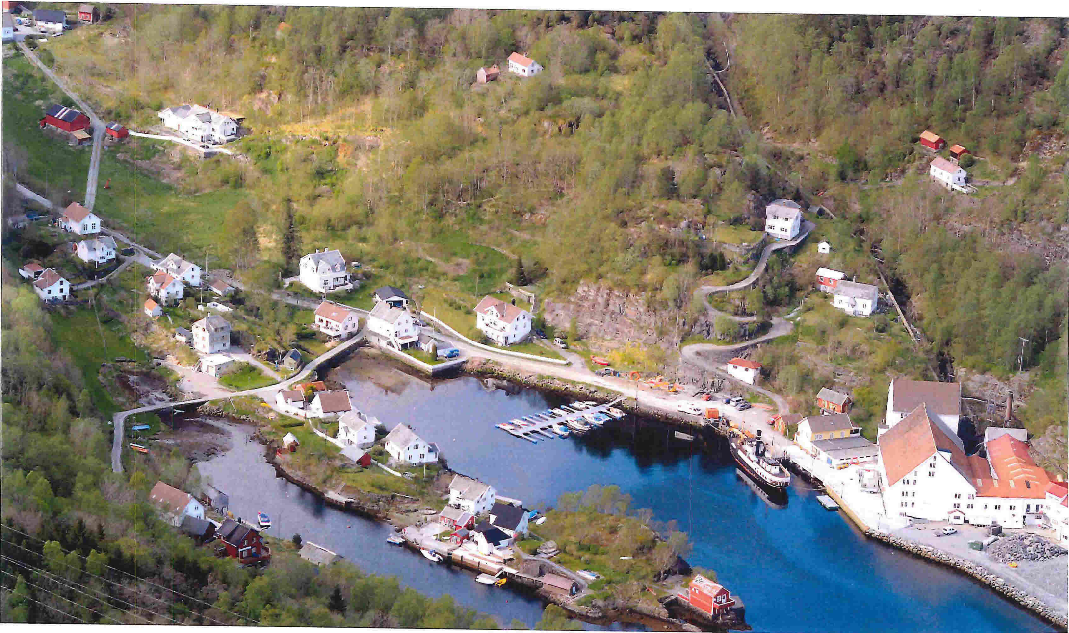
Bjørsvik i dag