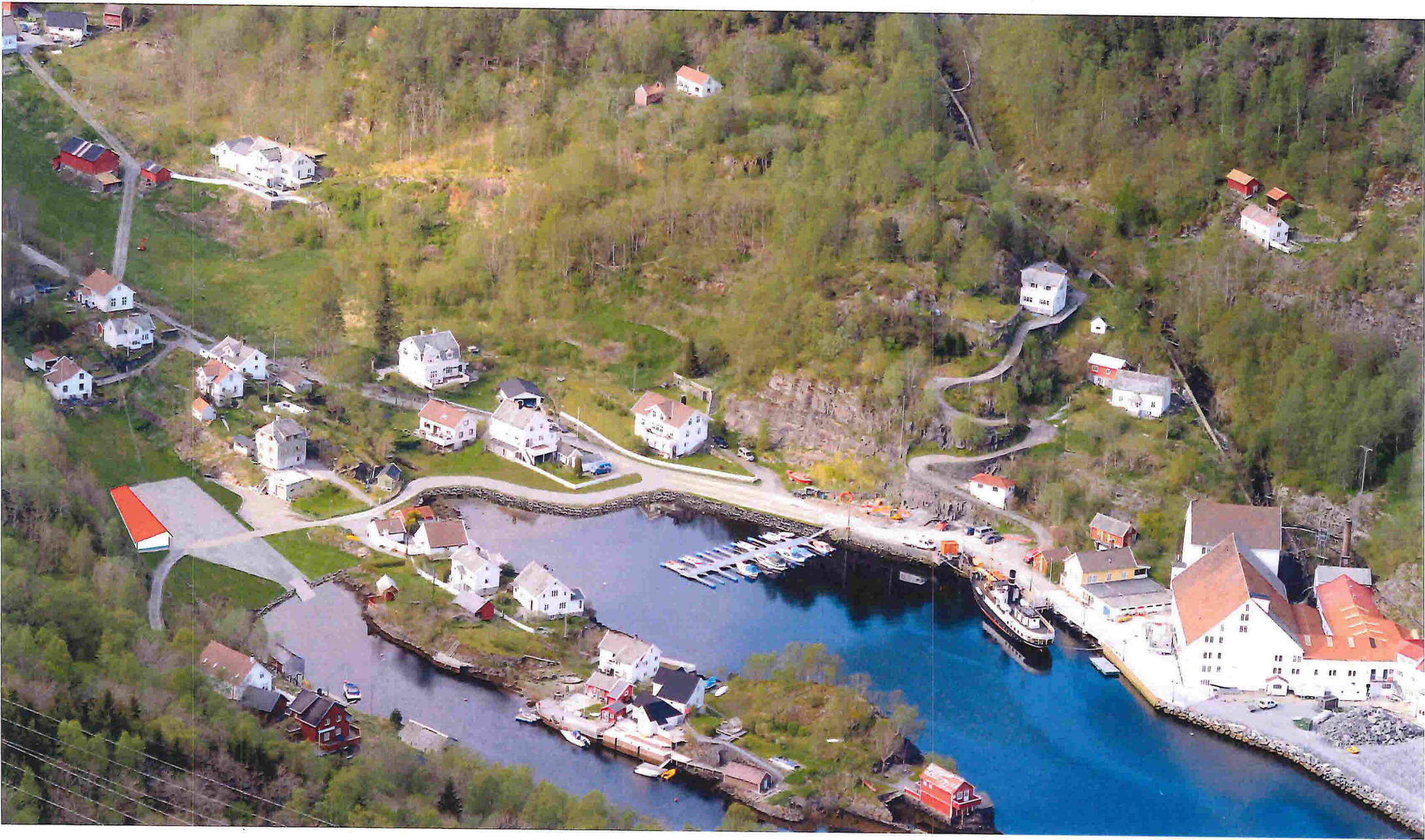
Bjørsvik med ny fylling