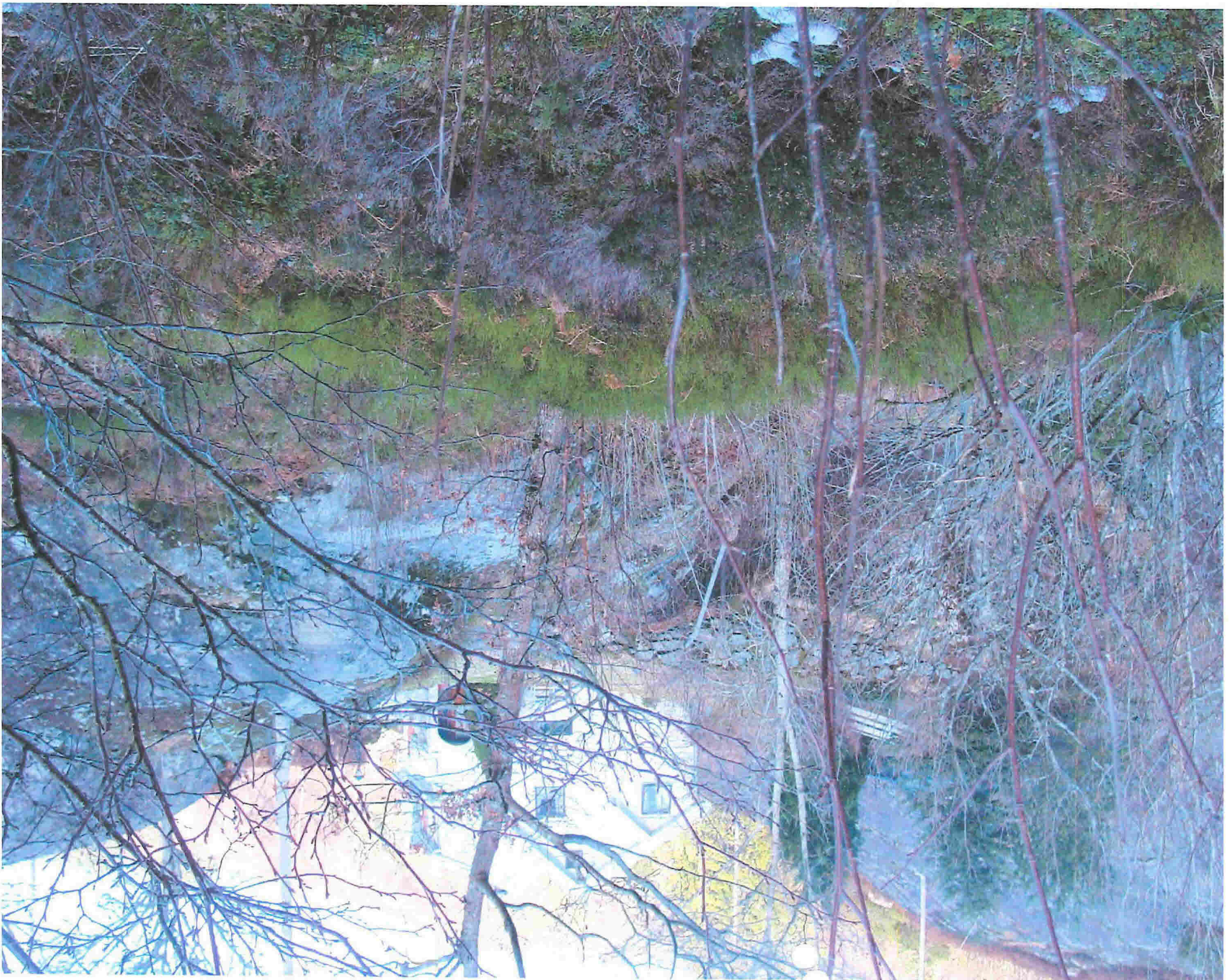
The fountain next to house