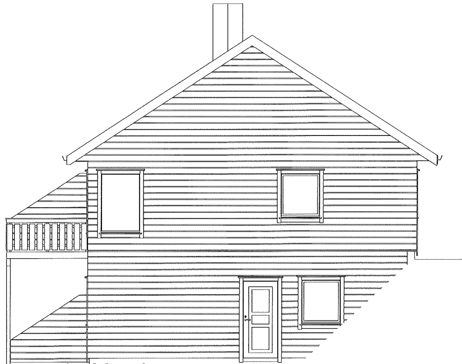
Fasade Nord 1 : 100