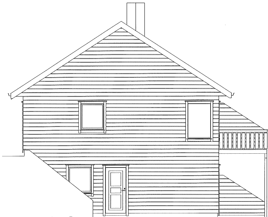
Fasade Sør 1 : 100