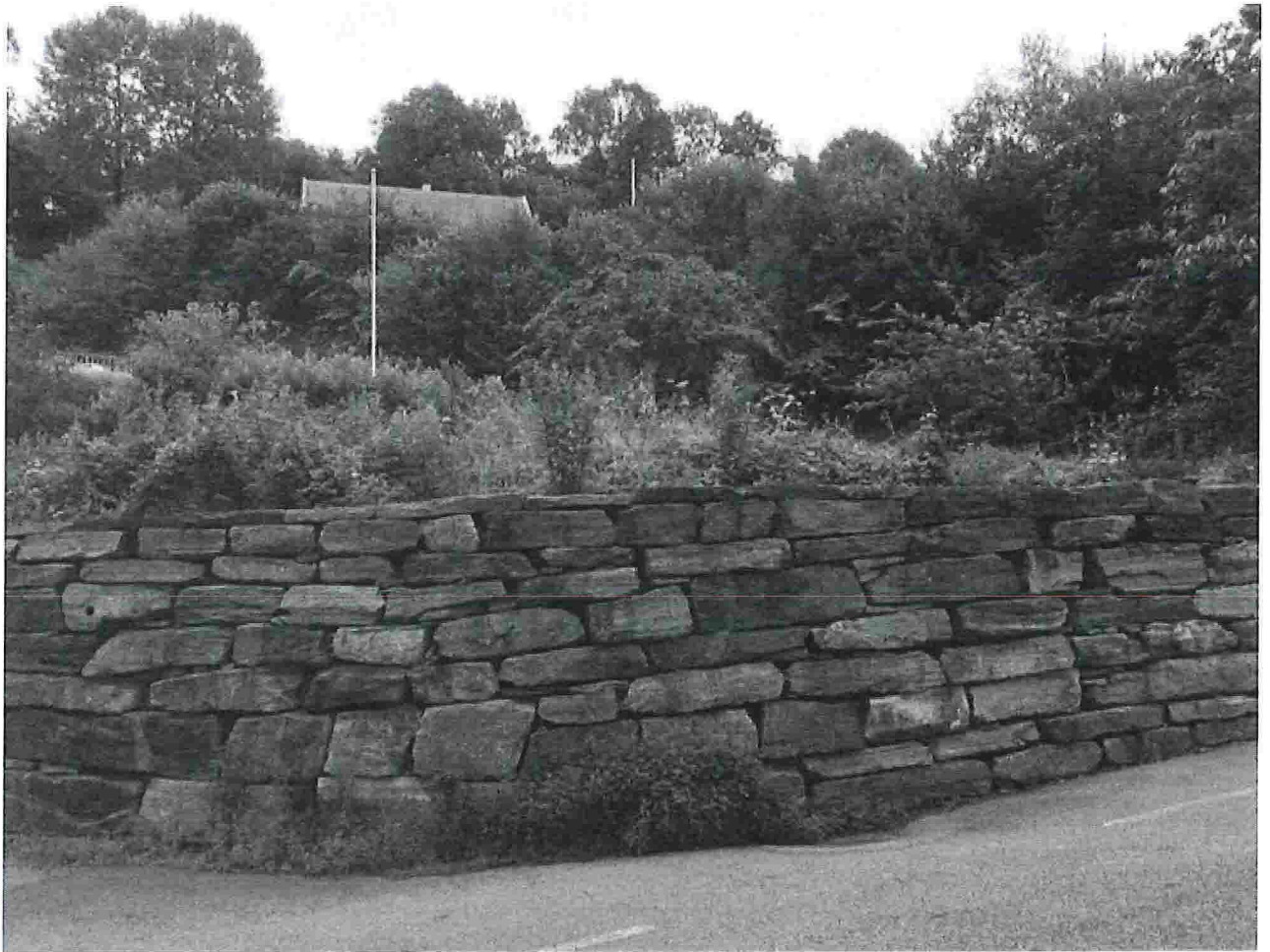
Fig. 2. Arealet der en liten avkjørsel ville kunne gå på innsiden av fortau.

Bildet er tatt like ved posisjonen til personen til høyre på Fig.1. Vi ser eksisterende mur og det ubeplantete krattet som omtales som en stor del av hagen til 141/41.