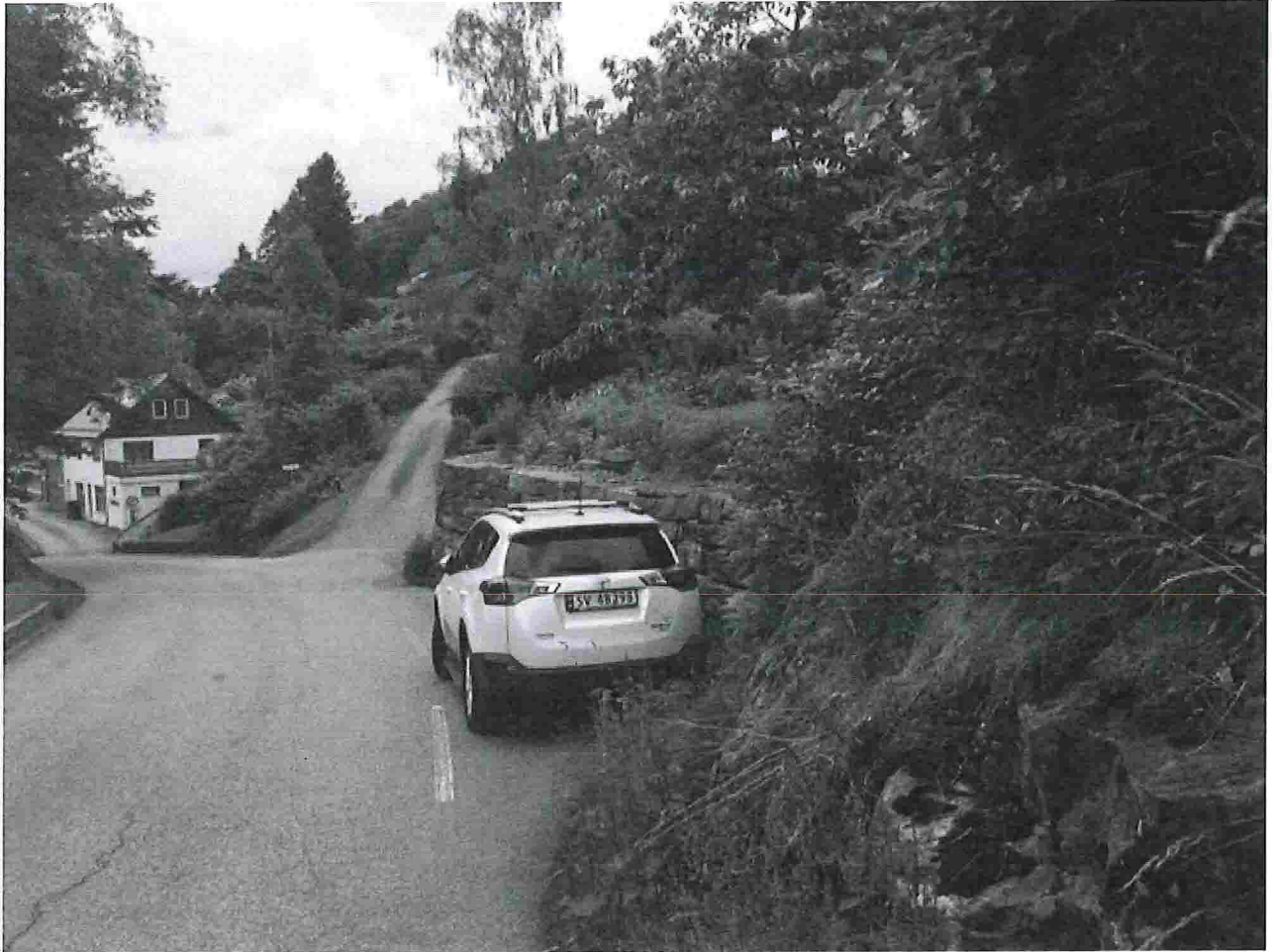
Fig. 3. Samme område som på Fig. 1, men sett nordover.

Bildet er tatt mot nord, der vi ser Kvamsvåg landhandel nederst i Kvamsbrekka. I midten av bildet, ovenfor kjøretøyet, ses det området som opprinnelig var avgitt som avkjørsel og mulig parkering for 141/15, tegnet inn på Kart 1.