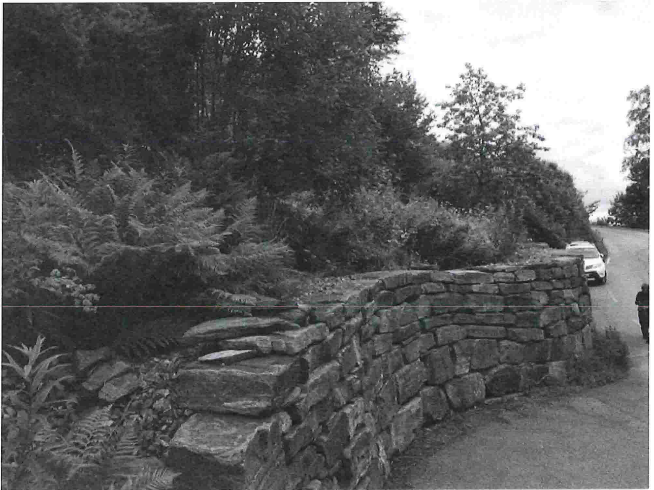
Fig. 1. Bunnen av Kvamsbrekka, sett mot sør.

Bilde tatt nordfra, oppover mot Kvamsbrekka som ligger til høyre. Bildet er tatt inne fra avkjørselen som går østover fra Kvamsbrekka, (merket f_SV7 på kart 1). Kjøretøy fra 141/15 står parkert utenfor eksisterende vei, men dette området vil bli fjernet og brukt til ny vei. Det området som er omtalt som en stor del av hagen, er krattet som man ser rett frem i bildet.