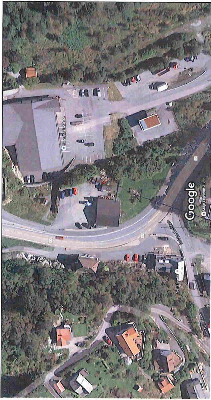
10 m