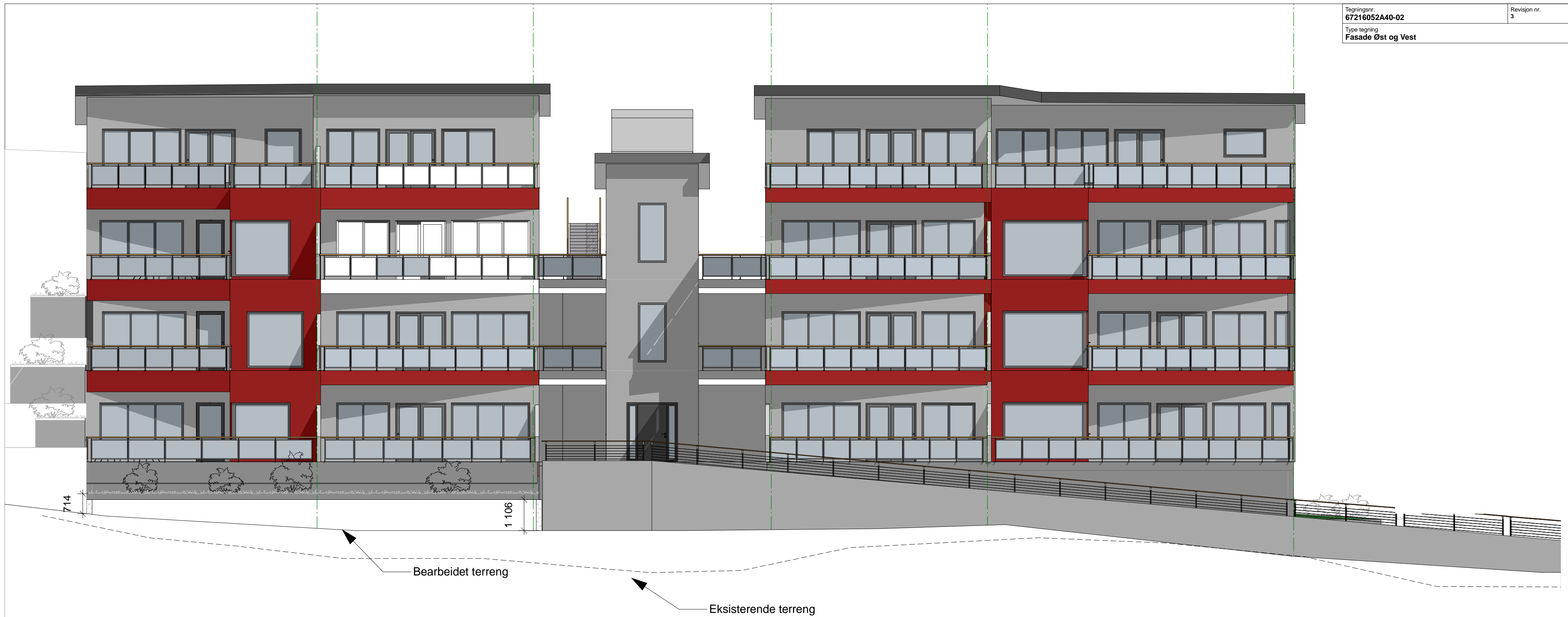
1:100 Fasade Vest