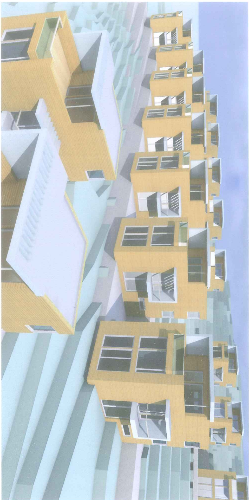
KAPASITETSVURDERING - Gnr. 137 • Bnr. 293+216+521 - Foreløpig utkast