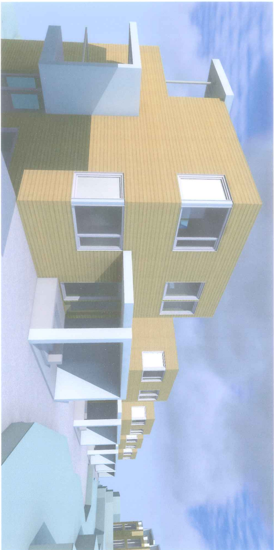
KAPASITETSVURDERING - Gnr. 137 • Bnr. 293+216+521 - Foreløpig utkast