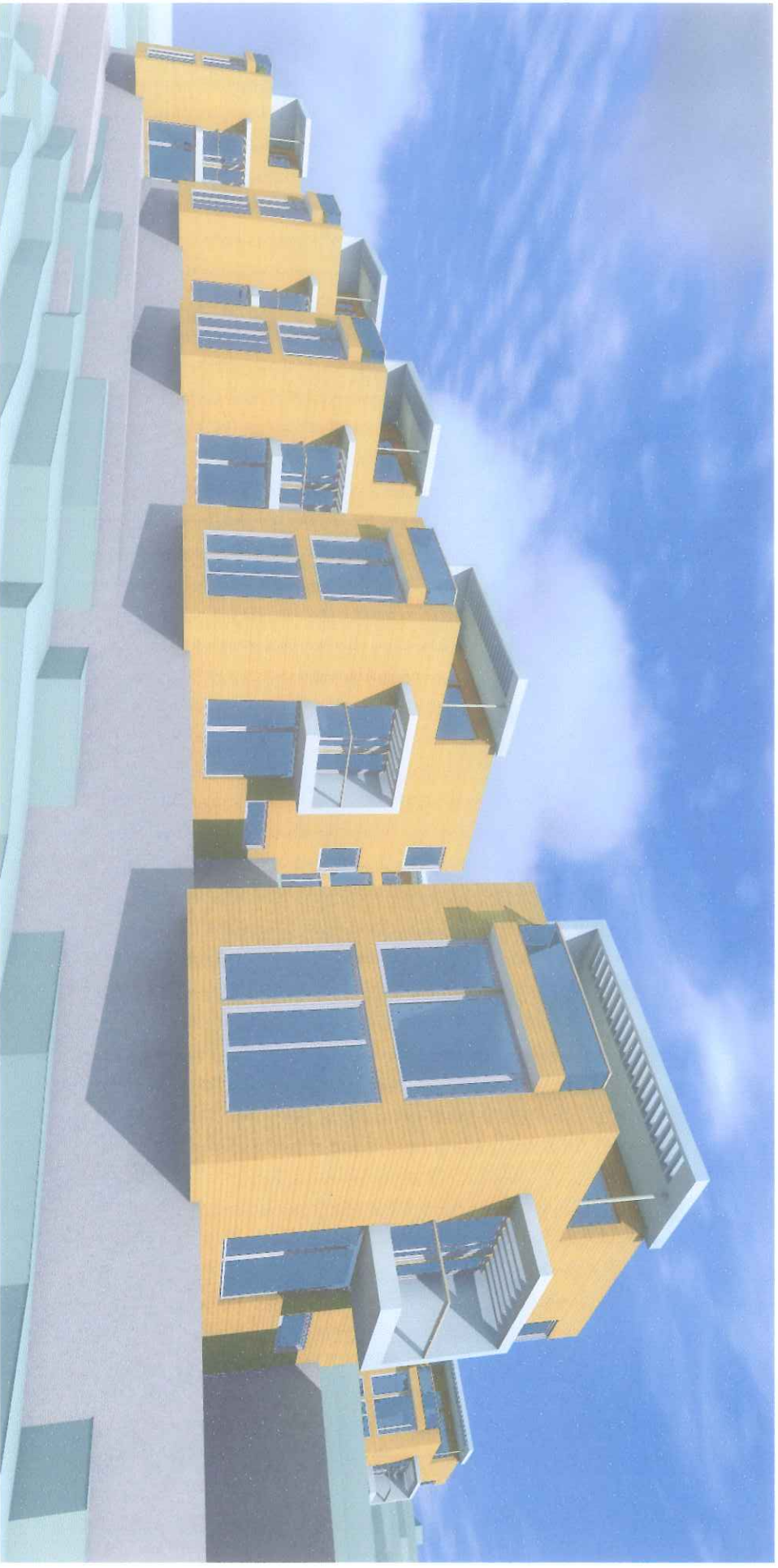
KAPASITETSVURDERING - Gnr. 137 • Bnr. 293+216+521 - Foreløpig utkast