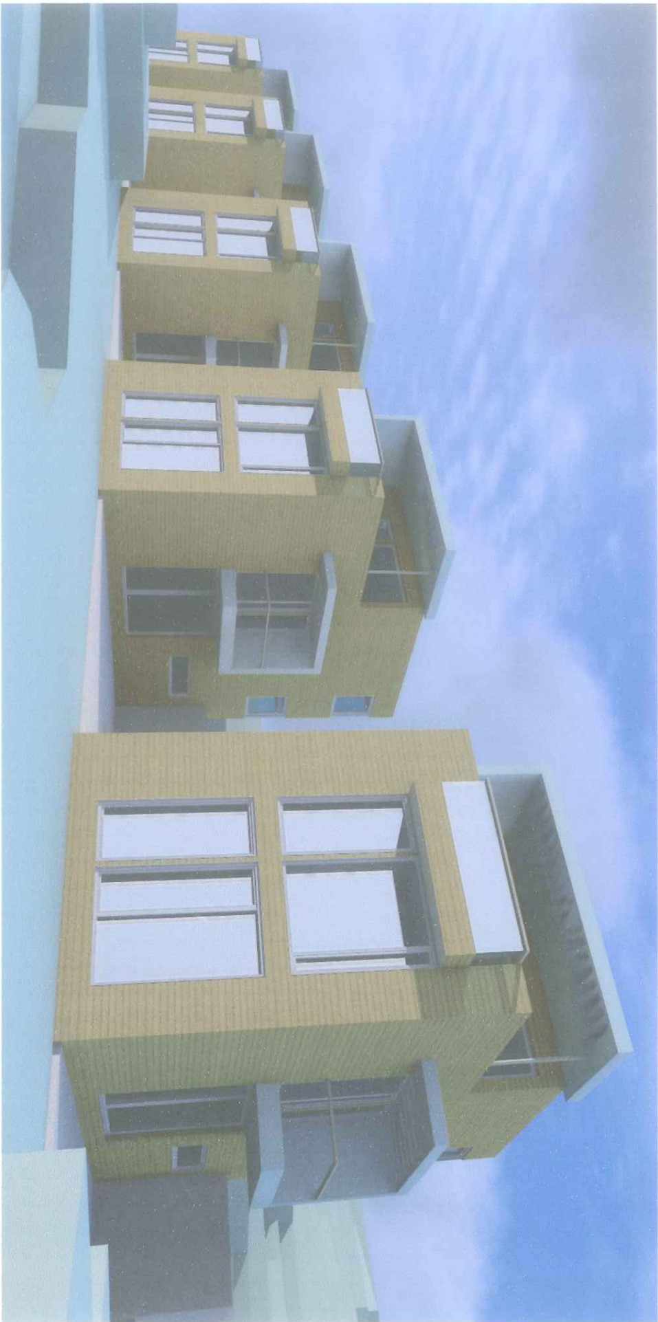
KAPASITETSVURDERING - Gnr. 137 • Bnr. 293+216+521 - Foreløpig utkast