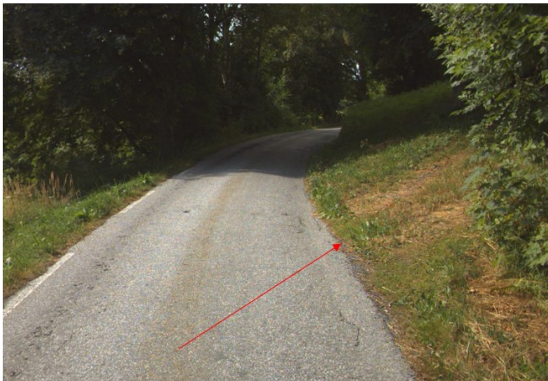
Bilde: Dagens avkøyrsla på bnr. 7 som eventuelt skal stengast

Tiltaket ligg i eit område som er avsett til landbruk-, natur- og friluftsliv (LNF) jf. Kommunedelplan (KDP) for Lindåsosane, Lygra og Lurefjorden (2008), med omsynssone H_510 Landbruk . Statens vegvesen vurderer at søknadene er avhengig av dispensasjon etter plan- og bygningslova, med bakgrunn i at det er planlagt ny tilkomstveg og at det er søkt frådelling av ny bustadtomt.