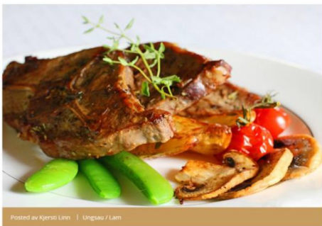
Postet av Kjersti Lønn | Ungsau / Lam

Lammekoteletter, indrefilet og ytrefilet