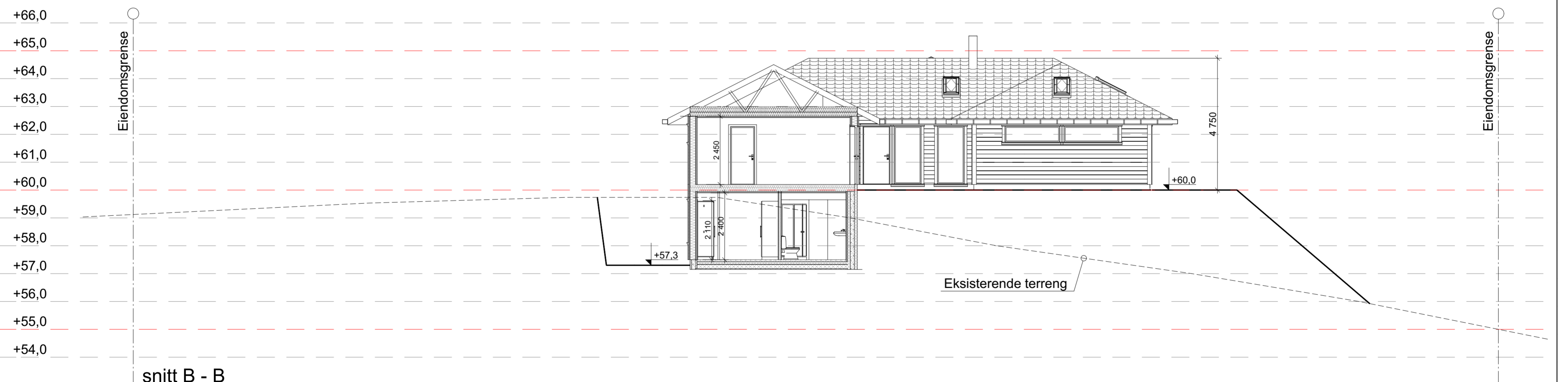
snitt B - B