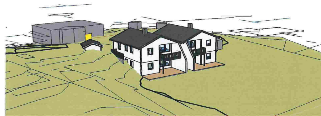
3D View 2