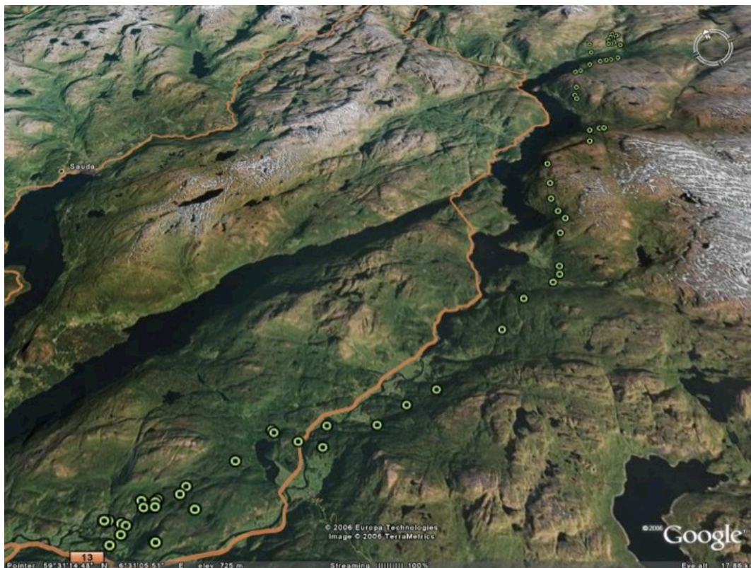
Bildet viser hjortevandring i Suldalsdalføret, Suldal i Rogaland. Denne hjorten brukar 5 mil lang strekningskorridor mellom sommar og vinterleveområde

Det er i mange samanhengar peika på potensialet som ligg i hjorten som ressurs. Prosjektet sine mål om styrkja ressursforvaltning, vil sikra betre rammevilkår og meir forutsigbarhet for næringsmessig utnytting, ved at utviklinga av hjortebestandane blir meir forutsigbar med eit meir styrt forvaltning på bestandsnivå.