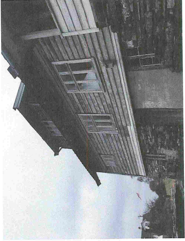
Fra sør vest