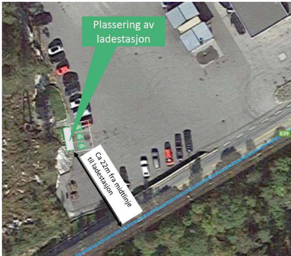
Bilde 1.1 Bilde av område med plassering av ladestasjon